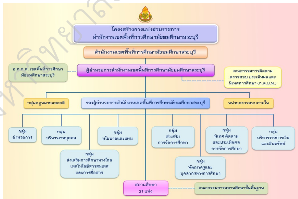
ภาพ 2 แผนผังโครงสร้างการแบ่งส่วนราชการสำนักงานเขตพื้นที่การศึกษามัธยมศึกษาสระบุรี ที่มา : สำนักงานเขตพื้นที่การศึกษามัธยมศึกษาสระบุรี (2566, ย่อหน้า 2)