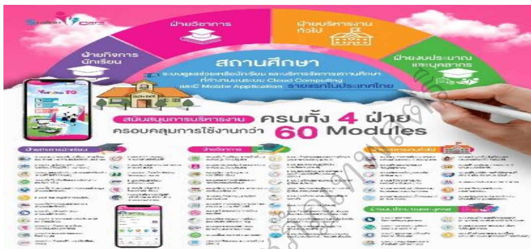
ภาพ 3 ระบบ Student Care Solution

นักเรียนและบริหารจัดการสถานศึกษา" ที่ทำงานบนคลาวด์คอมพิวเตอร์ (cloud computing) และให้บริการผ่านทางระบบเครือข่ายอินเทอร์เน็ต (software as a service) เน้นในเรื่องการติดต่อสื่อสารระหว่างโรงเรียนกับผู้ปกครองเป็นหลัก ผ่านทางโปรแกรมบนโทรศัพท์มือถือ (mobile application) โปรแกรมไลน์ (line application) และทางข้อความสั้น (SMS)