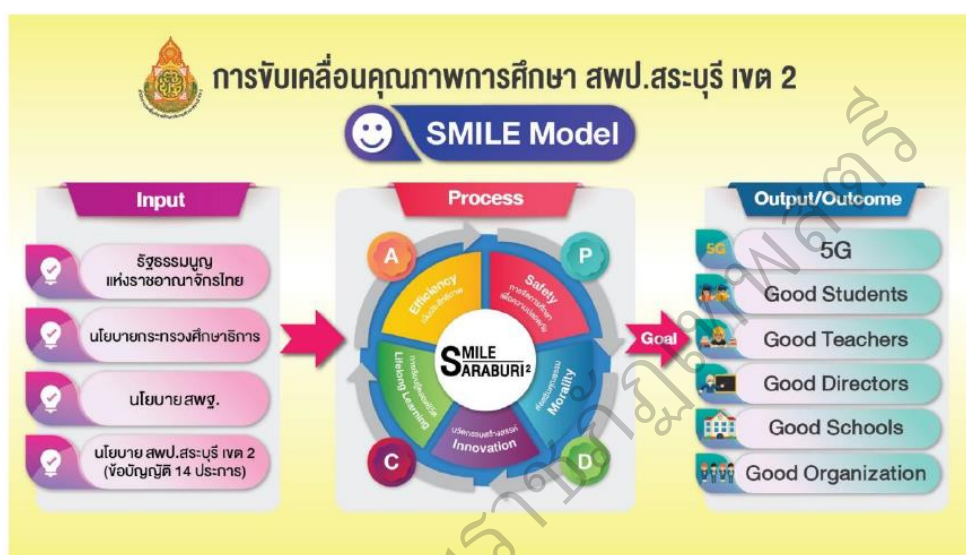
ภาพ 2 SMILE Model

การพัฒนาคุณภาพการศึกษาของสำนักงานเขตพื้นที่การศึกษาประถมศึกษาสระบุรี เขต 2 ใช้กรอบแนวคิดการบริหารจัดการวงจรคุณภาพ PDCA โดยมีนวัตกรรม SMILE model เป็นกลไกในการขับเคลื่อนการดำเนินงาน การพัฒนาคุณภาพการศึกษา มีผลสำเร็จที่มุ่งหวัง รายละเอียดดังต่อไปนี้