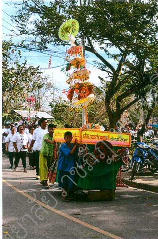
ภาพที่ ๒.๓ พิธีแห่สลากภัต

สำหรับชาวไทย-ยวน ทั้ง ๑๑ หมู่บ้านของตำบลหนองโน ได้จัดสลากภัตเพื่อเป็นส่วนหนึ่งของการทำบุญและมีอันสงฆ์ที่ยิ่งใหญ่นี้ อีกทั้งยังได้จัดทำสลากภัตไว้บนเกวียนที่ประดับประดาอย่างสวยงามเพื่อร่วมประกวดกัน เพื่อแสดงออกถึงความสามัคคี ความคิดริเริ่มสร้างสรรค์ นับเป็นการสืบสานและสร้างสรรค์ ตลอดจนอนุรักษ์ประเพณีถวายสลากภัตของชาวไทย-ยวน และชาวล้านนาไว้ด้วย