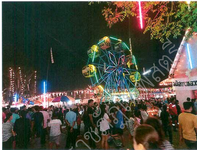
ภาพที่ ๒.๑๒ กิจกรรมชิงช้าสวรรค์และกิจกรรมภาคบันเทิง

ในประเพณีตักบาตรข้าวหลามจีเดือนยี่ที่หนองโนทุกครั้ง ความเป็นธรรมชาติและ การสร้างบรรยากาศแบบงานวัดย้อนยุคและรำวงย้อนยุคเป็นเสน่ห์ที่ดึงดูดให้ชาวไทย-ยวนและนักท่องเที่ยวต่างให้ความสนใจและชื่นชอบชื่นชมในความสนุกสนาน และความสวยงามที่ได้มีบรรยากาศที่ดี รวมถึงมีมุมถ่ายภาพต่างๆ มีกิจกรรมไหว้พระขอพร มีบรรยากาศกองฟาง แคร่ไม้ไผ่ ธงริ้ว ชิงช้าสวรรค์ ม้าหมุน ขนมสายไหม โดยเฉพาะรำวงย้อนยุคนั้นเพิ่มความสนุกสนานได้อย่างมาก