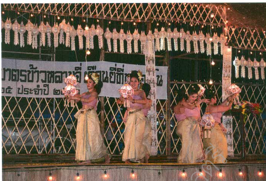
กิจกรรมการแสดง