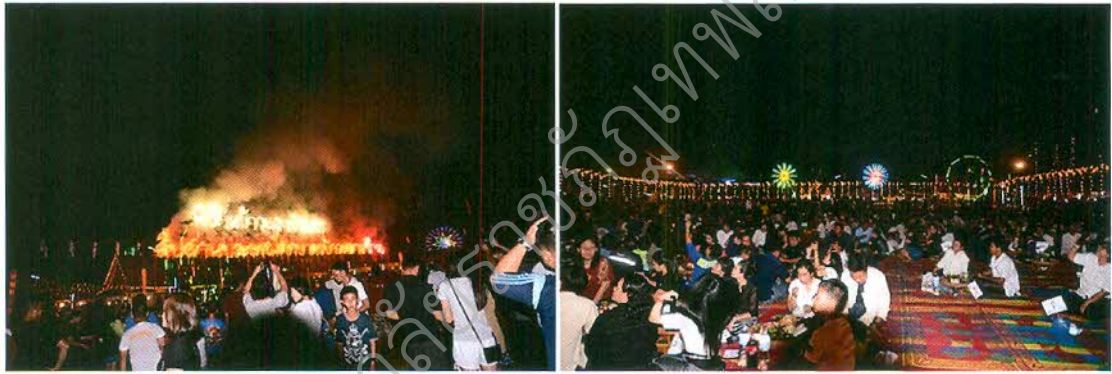
ภาพที่ ๒.๘ งานกินข้าวแลงขันโตก

นอกจากนี้ในพิธีเปิดงานกินข้าวแลงขันโตก ยังได้มีการประกาศผลและมอบรางวัลการประกวดต่าง ๆ อีกด้วย ซึ่งกิจกรรมการประกวดต่าง ๆ เป็นการแสดงถึงความสามัคคีด้วย