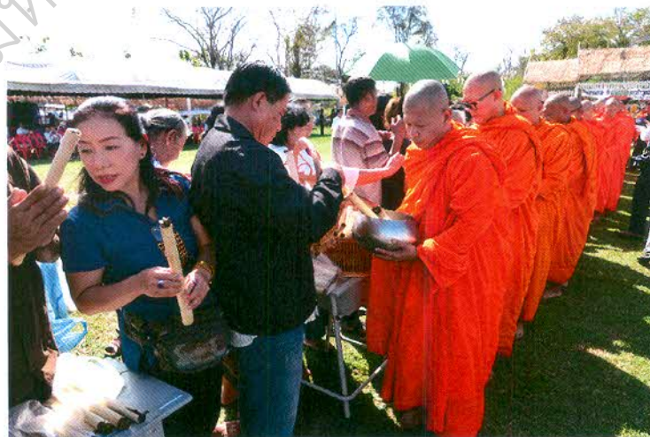
พิธีตักบาตรข้าวหลามจีเดือนยี่ที่หนองโน