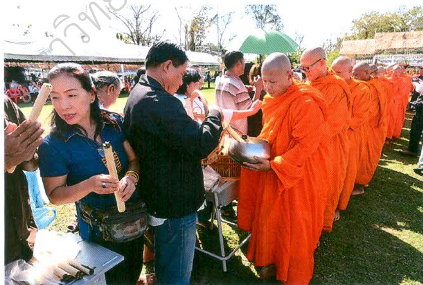
ภาพที่ ๒.๒ พิธีตักบาตรข้าวหلامจีเดือนยี่ที่หนองโน