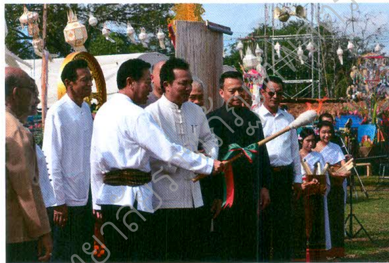
พิธีเปิดโดยผู้ว่าราชการจังหวัดสระบุรี ร่วมกับ นายกองค้การบรหิรสวนต่าบลหนองโน