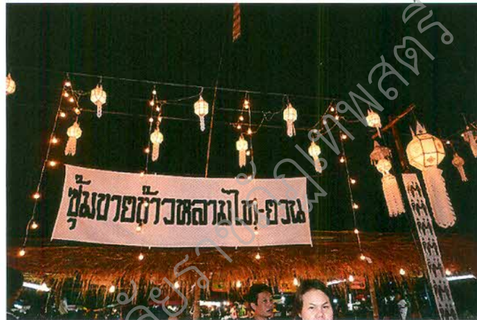
ภาพที่ ๒.๑๐ ซุ้มขายข้าวหลาม

การเลือกซื้อข้าวหลามจากซุ้มต่าง ๆ ซึ่งชาวไท-ยวน ได้เผาและนำมาขายเพื่อใช้สำหรับตัก บาตรและนำไปรับพรทาน เป็นทั้งของฝากที่อร่อยและร่วมสืบสานวัฒนธรรมการเผาข้าวหลามของ ชาวไท-ยวน ให้สืบต่อไป อีกทั้งยังเป็นการเพิ่มรายได้ให้กับประชาชนและชุมชนชาวไท-ยวนอีกด้วย