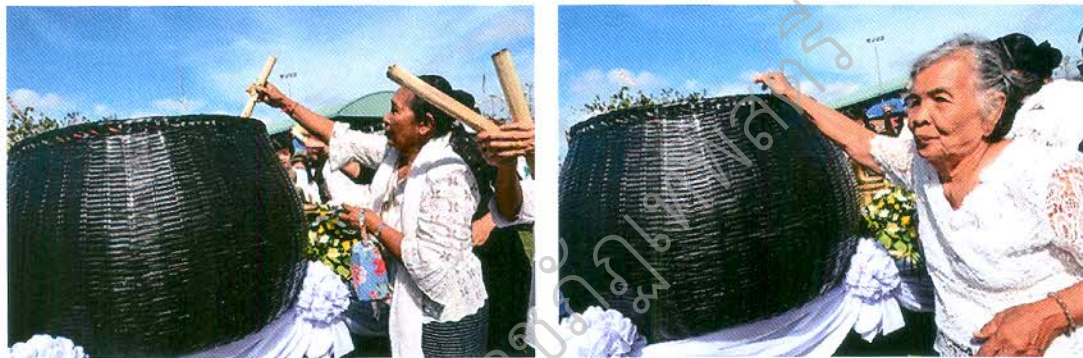
ภาพที่ ๒.๑ บาตรจำลองขนาดใหญ่

อาคารอเนกประสงค์องค์การบริหารส่วนตำบลหนองโน ตำบลหนองโน อำเภอเมือง จังหวัดสระบุรี โดยพระสงฆ์จะรับบิณฑบาตในเวลาประมาณ ๑๐.๐๐ น. สำหรับข้าวหلامที่นำมาใส่บาตรนั้นส่วนใหญ่จะเป็นข้าวหلامที่ชาวไทย-ยวน เฝ้าข้าวหلامนี้เองที่บ้านเพื่อนำมาใส่บาตรทำบุญ แต่ในกรณีนักท่องเที่ยวหรือประชาชนที่ไม่สะดวกในการเฝ้าข้าวหلامด้วยตนเองนั้น ก็จะนำข้าวหلامที่ชาวบ้านทำขาย มาใส่บาตรในครั้งนี้ ซึ่งนอกจากจะได้ทำบุญแล้วยังได้ช่วยเพิ่มรายได้ให้กับประชาชนชาวไทย-ยวน ในพื้นที่ได้อีกด้วย สำหรับผู้ที่มาร่วมพิธีตักบาตรข้าวหلامจีเดือนยี่ที่หนองโน ล้วนแต่มีใจและได้รับบุญกุศลโดยทั่วกัน โดยทุกคนที่มาร่วมประเพณีตักบาตรข้าวหلامจี เป็นส่วนสำคัญในการอนุรักษ์และสืบสานประเพณีอันดีงามนี้อย่างแท้จริง เช่น การสวมใส่ชุดไทย-ยวน เข้าร่วมพิธี และร่วมตักบาตรด้วยความเป็นระเบียบเรียบร้อยทุกขั้นตอนอย่างถูกต้อง เหมาะสมและสวยงาม