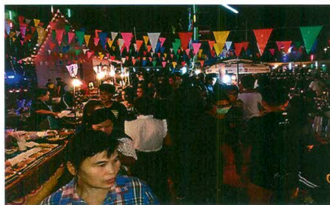
ภาพที่ ๒.๑๑ การออกร้านขายสินค้า

สินค้าในกลุ่มนี้เป็นทั้งเพื่อการอุปโภคและบริโภค โดยการบริโภค ได้แก่ อาหารต่างๆ ทั้ง ลูกชิ้นปิ้ง ลูกชิ้นย่าง ข้าวเหนียวหมู ข้าวเหนียวไก่ ก๋วยเตี๋ยว ยำ ขนมโบราณ เช่น บ้าบิ่น และขนมร่วม สมัยต่าง ๆ ซึ่งราคาไม่แพง สะอาด สะดวก สำหรับสินค้าในกลุ่มอุปโภค ก็คือ ผ้าและเสื้อผ้าไท-ยวน เครื่องประดับ และของใช้ ของประดับตกแต่งทั้งโบราณและร่วมสมัยเป็นต้น