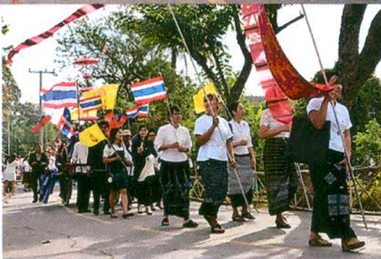
ภาพที่ ๒.๕ ขบวนแห่ประเพณีตักบาตรข้าวหลามจีเดือนยี่ที่หนองโน