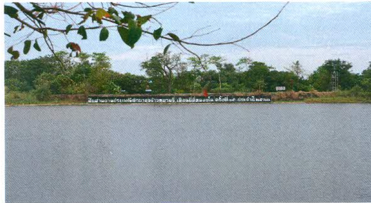
ภาพชื่องานที่มีความสวยงาม