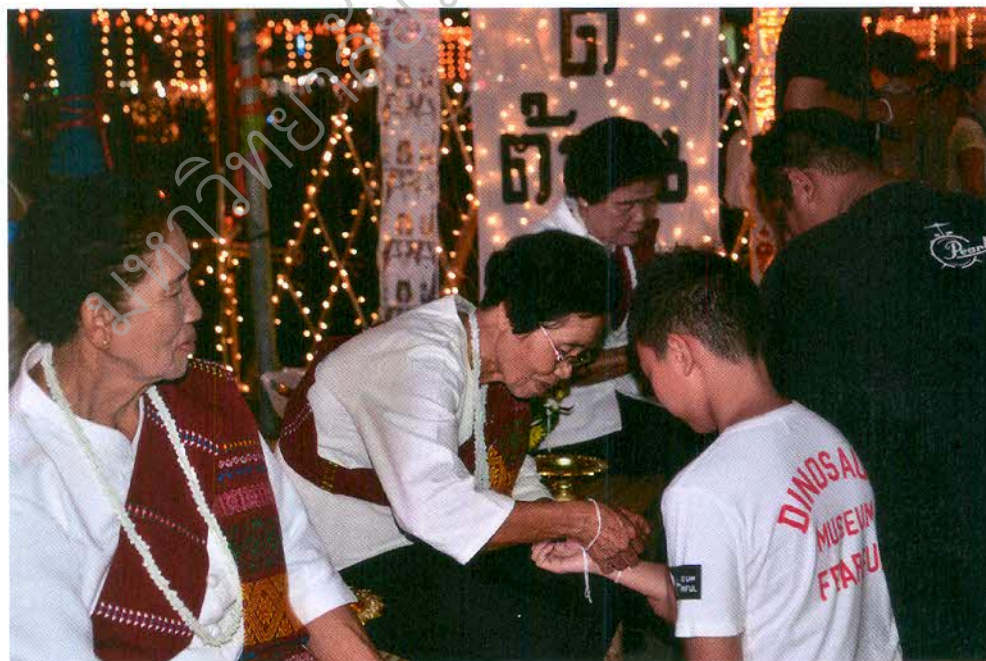
พิธีบายศรีสู่ขวัญ ก่อนเข้าพิธีขันโตกพาสแลง โดยปราชญ์ชาวบ้าน