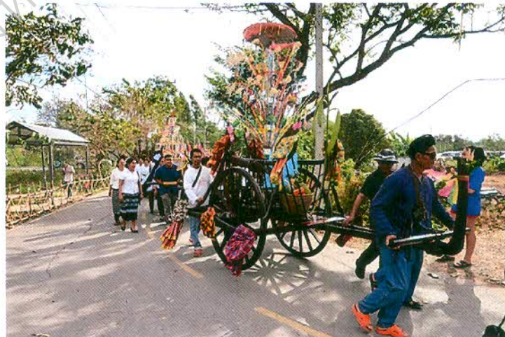
ภาพที่ ๒.๔ พิธีแห่สลากภัต