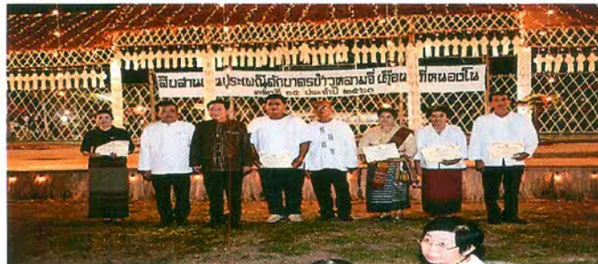
ภาพที่ ๒.๙ ผู้ชนะการประกวดรับมอบเกียรติบัตร

กิจกรรมการประกวดนับว่าเป็นอีกส่วนสำคัญที่กระตุ้นให้ประชาชนชาวไทย-ยวน มีกิจกรรมที่เชื่อมโยงไปกับความสามัคคีในหมู่คณะเบื้องต้น โดยหลักคิดคือ เพื่อเป็นขวัญและกำลังใจให้กับชุมชนและประชาชนที่ส่งผลงานของตนเข้าร่วมประกวด และเพื่อกระตุ้นให้มีความพยายามที่จะสร้างสรรค์งานต่างๆ ให้งดงามเพื่ออวดแขกบ้านแขกเมืองอีกแนวคิดหนึ่งด้วย โดยกิจกรรมการประกวดประกอบด้วย ประกวดเขียนโบราณและต้นสลากภัต การประกวดข้าวหลามอร่อย และการประกวดละอ้อนไทย-ยวน หนองโน อีกด้วย