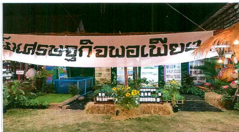
ภาพที่ ๒.๗ ชุมแสดงเศรษฐกิจพอเพียง

ชาวไทย-ยวน ในตำบลหนองโน อำเภอเมือง จังหวัดสระบุรีกลุ่มนี้ให้ความสำคัญกับวิถีเศรษฐกิจพอเพียงทุกหมู่บ้าน โดยเฉพาะหมู่ที่ ๗ บ้านแกว ซึ่งเป็นศูนย์การเรียนรู้เศรษฐกิจพอเพียงระดับจังหวัด และเป็นแหล่งศึกษาดูงานทั้งในระดับภาคและระดับประเทศ ดังนั้น เพื่อเป็นการถ่ายทอดองค์ความรู้แนวคิดด้านเศรษฐกิจพอเพียงตามแนวทางพระราชดำรินของในหลวงรัชกาลที่ ๙ อีกทั้งยังเป็นนิทรรศการที่เทิดพระเกียรติและถวายความอาลัยพระองค์ท่านอีกด้วย ซึ่งชาวไทย-ยวนทั้งหลาย ได้ร่วมกับพนักงานและเจ้าหน้าที่องค์การบริหารส่วนตำบลหนองโน ได้จัดนิทรรศการแห่งความจงรักภักดีและแสดงวิถีเศรษฐกิจพอเพียง ซึ่งแสดงถึงความสามัคคีของชาวไทย-ยวนได้อีกด้วย