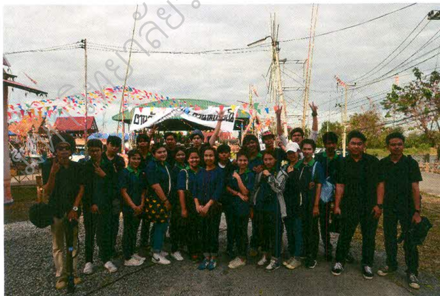
คณะทำงาน