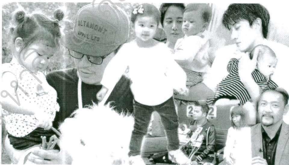
วันที่นำเสนอ 21 มกราคม 2559

วันที่ 10 อัปโหลดเมื่อวันที่ 21 พฤศจิกายน 2558 พาดหัว “พระเอกลูกโผล่ ไม่ใช่เรื่องใหญ่ สังคมไทยยุคใหม่ใจกว้างจะตาย” เป็นการนำเสนอในลักษณะการแสดงความคิดเห็นส่วนตัว เกาะกระแสข่าว ปอ-ทฤษฎี โดยบุคคลในวงการบันเทิงที่มีลูกและถูกหีบภาพมานำเสนอนั้นล้วนแล้วแต่เคยปรากฏเป็นข่าวและมีการออกมาชี้แจง แฉลงข่าวแล้วให้สังคมเข้าใจแล้วทั้งสิ้น ซึ่งไม่ควรจะนำมาเสนออีก เพราะไม่ได้มีประเด็นข่าวหรือเนื้อหาเพิ่มเติมจากเดิม ที่สำคัญคือถือเป็นการละเมิดสิทธิส่วนบุคคล โดยเฉพาะกรณีที่มีการนำภาพของ ปัง - ประภาศิต โบสุวรรณ ทั้ง ๆ ที่สังคมได้รับทราบแล้วว่าได้มีการตรวจดีเอ็นเอแล้วว่าไม่ใช่ลูกของตน ซึ่งกรณีนี้ถือเป็นเรื่องสิทธิส่วนบุคคล