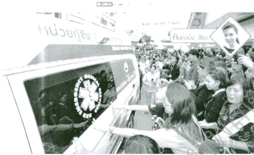
วันที่นำเสนอ 26 มกราคม 2559

Line ID: @doh123 (LINE ID: 2559 26 01) ☎ 30,908 พว