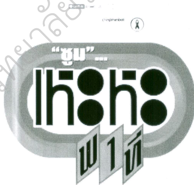
วันที่นำเสนอ 21 มกราคม 2559

Line ID: @doh123 (LINE ID: 2559 26 01) ☎ 1,234 พว