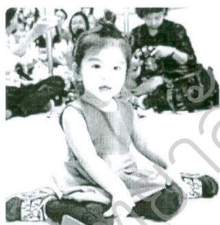
(ท็อป) ไร่เกียกกี