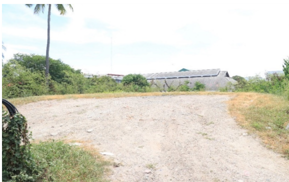
ภาพที่ ๕.๑๘ ภาพ ป้อมมเหศวร (เหลือแต่ฐานเนินดิน)