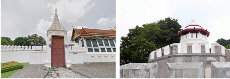
ภาพซุ้มประตู และป้อมพระบรมหาราชวัง

จิตรกรได้นำรูปแบบพระบรมหาราชวังในกรุงเทพมหานครมาถ่ายทอดไว้ในงานจิตรกรรมสื่อให้เห็นถึงสถาปัตยกรรมความรุ่งเรืองของไทย ยุคต้นกรุงรัตนโกสินทร์