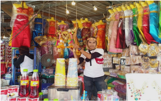
ภาพที่ ๑๐ ผู้นำเรือมาทำพิธีเสริมเรืออีกครั้ง

๒. การศึกษาบทบาทพิธีกรรมเศรษฐกิจเรือทอง วัดพุน้อย ตำบลขอนแก่น อำเภอบ้านหมี่ จังหวัดลพบุรี