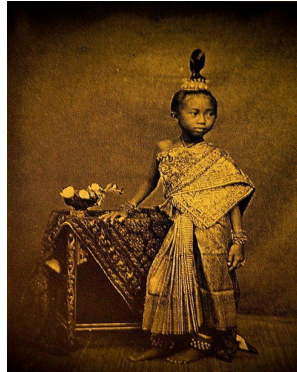
ทรงผมของหญิงไทยสมัยโบราณและหญิงชาวเหนือ