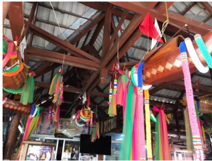
ภาพที่ ๗ เรือแม่ตะเคียนทอง

๘. ไม่ควรปล่อยให้เรือสกปรก หมั่นทำความสะอาด ปิดทอง เปลี่ยนพวงมาลัย หัวใจสำคัญ ในการบูชาเรือคือข้อหนึ่งหากทำได้ชีวิตก็มีแต่สุข (มูลนิธิเศรษฐีเรือทอง วัดพุน้อย, ๒๕๖๑, ย่อหน้า ๒)