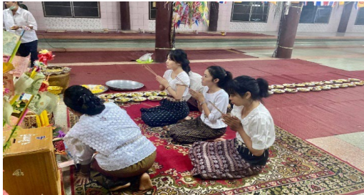
ภาพที่ ๖ การกราบบูชาพระรัตนตรัยก่อนแห่ข้าวพั้นก้อน

๑.๒.๓.๑ เริ่มต้นจากการจุดธูป เทียน เพื่อบูชาพระรัตนตรัย