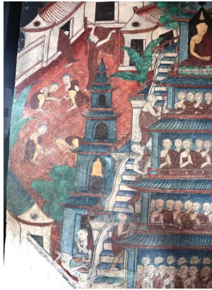
ภาพปริศนาธรรม

ในภาพมีพระสงฆ์อีกจำนวนหนึ่งที่ไม่สนใจปฏิบัติธรรม ไม่ฟังธรรม ได้แต่ปฏิบัติกิจของสงฆ์โดยทั่วไปเช่น ชักจีวร จำวัด นั่งชูปชบนินทา พระภิกษุเหล่านี้ไม่มีทางที่จะได้เป็นอริยบุคคล นี่อาจเป็นภาพที่ต้องการเขียนเพื่อสอนธรรมให้กับพระภิกษุที่เกี่ยวข้องรันท่านก็อาจเป็นได้