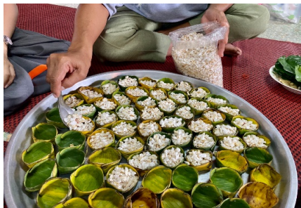
ภาพที่ ๒ ข้าวตอกใส่ในกระทง

๑.๒.๒.๓ มีการนำข้าวตอกมาใส่ในกระทงใบตอง เพื่อนำไปใช้ในการประกอบในพิธีแห่ข้าวพุ้นก้อน