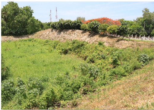
ภาพที่ ๔.๘ เพนียดคลองช้าง