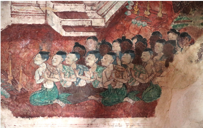
ประเพณีการทำบุญตักบาตรและทรงผม