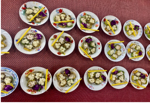
ภาพที่ ๕ การจัดเรียงงานใส่ข้าวพั้นก้อน

๑.๒.๒.๖ นำข้าวพั้นก้อน ข้าวตอก ดอกบานไม่รู้โรย และเทียน ๑ เล่ม จัดใส่จานวางเรียงเป็นแถวให้เรียบร้อย