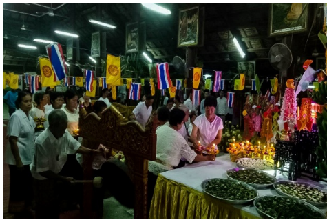
ภาพที่ ๑๓ การจุดเทียนในการเทศน์มหาชาติ

๕) เจ้าของกัณฑ์เทศน์ จะนิมนต์พระนักเทศน์เฉพาะกัณฑ์นั้น ๆ เรียกว่า “เทศน์กินกัณฑ์” ในระหว่างที่พระกำลังเทศน์ เจ้าของกัณฑ์จะจุดเทียนเท่ากับพระคาถาประจำกัณฑ์รอบซันสาครที่ตั้งไว้ เพื่อเป็นการบูชากัณฑ์เทศน์ ซึ่งห้ามให้เทียนขาด โดยการจุดเทียนตามพระคาถาพันจะช่วยให้เกิดความศักดิ์สิทธิ์ เมื่อจบการเทศน์แต่ละกัณฑ์ พระสงฆ์จะให้พรขณะนั่งอยู่บนธรรมาสน์ เมื่อให้พรเสร็จแล้วจะลงมาจากธรรมาสน์เพื่อมารับเครื่องกัณฑ์จากเจ้าของประจำกัณฑ์ เมื่อเจ้าภาพถวายเสร็จก็ถือว่าเป็นอันเสร็จพิธีกรรมในส่วนกัณฑ์นั้น ในกัณฑ์ต่อมาก็ปฏิบัติเช่นเดียวกัน ซึ่งในการเทศน์พระนักเทศน์จะใช้น้ำมนต์ธรรมวัตรจนจบ ๑๓ กัณฑ์ โดยจะเริ่มเรื่องด้วยนะโมห้าชั้นแล้วตามด้วยฉนวนยิบทประจำแต่ละกัณฑ์