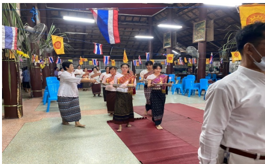
ภาพที่ ๑๐ การเดินเรียงแถวมาวางข้าวพันก้อน

๑.๒.๓.๕ เมื่อเวียนครบ ๓ รอบแล้ว จะต้องนำข้าวพันก้อนที่แห่ไปวางหน้าธรรมาสน์