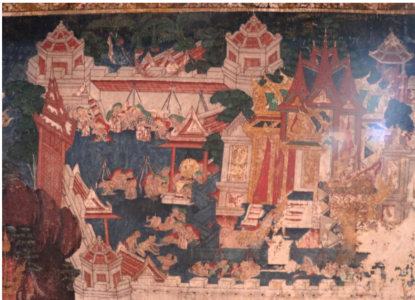
ภาพซุ้มประตูพระบรมมหาราชวัง และป้อมยามในงานจิตรกรรม