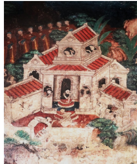
ภาพสถาปัตยกรรมแบบจีน ในงานจิตรกรรม

ภาพอาคารสถาปัตยกรรมที่แสดงให้เห็นการรับอิทธิพลจากจีน เพราะในยุคนั้นการค้าขายกับชาวจีนกำลังเฟื่องฟู ในงานจิตรกรรมเป็นอาคารสองชั้นมุงด้วยกระเบื้องเคลือบ อาจหมายถึงวัดหรือที่อยู่ของชนชั้นสูงที่มีฐานะ เป็นที่พักซึ่งเป็นรูปแบบนิยมในสมัยรัชกาลที่ ๓ ดังจะเห็นได้จากวัดวออารามสมัยรัชกาลที่ ๓ ที่นิยมสร้างแบบศิลปะจีน เช่น วัดราชโอรสารามราชวรวิหาร เป็นต้น