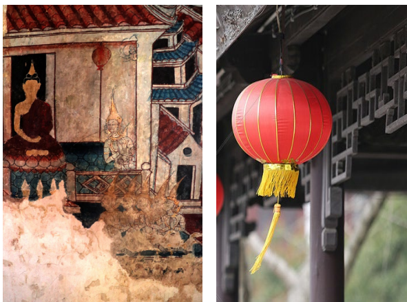
ภาพโคมไฟแบบจีน

โคมจีนสีแดงเป็นสัญลักษณ์มงคลอย่างหนึ่งของจีนที่ปรากฏอยู่ในงานจิตรกรรม คนเชื้อสายจีนก็มักจะประดับประดาหน้าบ้านด้วยโคมจีนสีแดง ซึ่งเป็นสัญลักษณ์ว่า เป็นบ้านคนเชื้อสายจีนอยู่อาศัย โคมจีนเป็นเครื่องขึ้นให้สิ่งศักดิ์สิทธิ์ตามความเชื่อของคน จีนได้มองเห็นบ้านที่ห้อยโคมจีนก่อน และช่วยให้คนในบ้านนี้มีความสุขความเจริญ ความร่ำรวย และยังหมายถึง แสงสว่างโชติช่วงชัชวาล นอกจากนี้ สีของโคมจีนก็ยังมี ความหมาย โคมจีนสีแดงเป็นสีโชคลาภวาสนา เป็นสีมงคลของคนจีน (โคมจีน. ๒๕๖๔. ออนไลน์)