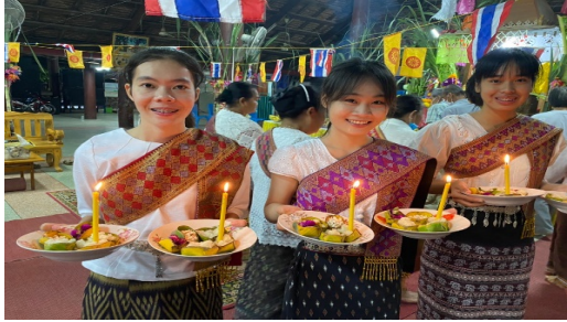
ภาพที่ ๗ การจุดเทียนปักลงในจานข้าวพันก้อน

๑.๒.๓.๒ จากนั้นเริ่มจุดเทียนและปักลงในจาน หรือถาดกระทง ข้าวเหนียว เพื่อใช้ในการประกอบพิธีการแห่ข้าวพันก้อน