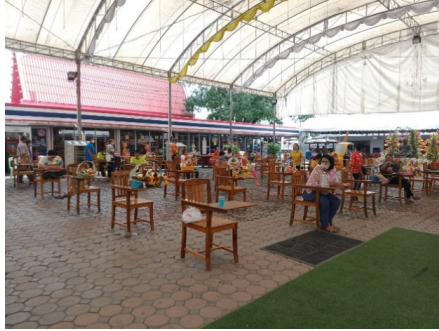
ภาพที่ ๓ การจัดเตรียมสถานที่ประกอบสำหรับผู้รอเข้าร่วมพิธี

นอกจากนี้ยังมีการจัดเตรียมสถานที่ไว้สำหรับผู้ที่มาขอทำพิธีที่ยังไม่ถึงลำดับของตนเองไว้ทางด้านล่างของศาลาเพื่อที่การทำพิธีจะได้เป็นไปด้วยความเรียบร้อย เพราะทางวัดจะจัดลำดับผู้เข้ายกเรือไปที่ละชุด เพื่อไม่ให้พื้นที่ภายในพิธีแออัดยัดเยียดกันมากเกินไป โดยเตรียมสถานที่ไว้ให้ผู้เข้าร่วมพิธีท่านอื่น ๆ รอด้านล่างศาลา