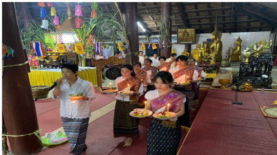
ภาพที่ ๘ การแห่ข้าวพันก้อน

๑.๒.๓.๓ เริ่มการแห่วนรอบศาลาการเปรียญจำนวน ๓ รอบ จะมีการร้องโห่ประกอบพิธีเมื่อเดินเวียนครบแต่ละรอบ ซึ่งถือได้ว่าเป็นการบูชาพระรัตนตรัย