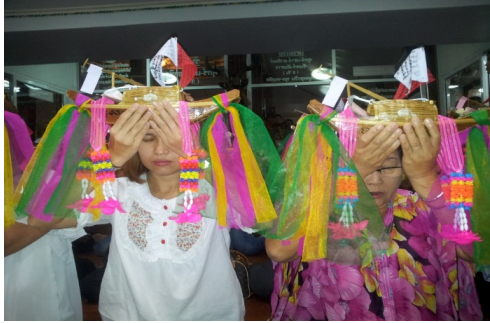
ภาพที่ ๕ เรือที่ผู้เข้าร่วมพิธีใช้สำหรับทำพิธียกเรือ