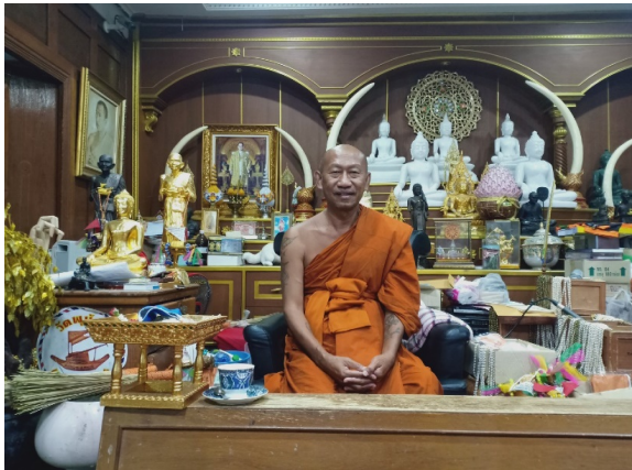
ภาพที่ ๔ เจ้าอาวาสผู้ทำพิธียกเรือและเสริมเรือ

ตั้งแต่เจ้าอาวาสเริ่มกล่าวเชิญแม่ตะเคียน ผู้ร่วมพิธีบางคนเริ่มมีอาการตัวสั่น ส่งเสียงร้องไห้และบางคนลุกขึ้นมาแสดงอาการร่ายรำตามจังหวะเพลง จากคำพูดเชิญชวนของ เจ้าอาวาสแสดงว่า จิตวิญญาณของแม่ตะเคียนต้องการร่ายรำตามคำเชิญชวน ทำให้ผู้เข้าร่วมพิธีกรรมมีอาการดังกล่าว การที่เขา ร่ายรำออกมาต้องเกิดจากจิตที่นิ่งของเขาด้วยที่สามารถส่งผ่านไปยังแม่ตะเคียนได้ ตอนที่รำก็ไม่มีใครรู้ว่าตนได้แสดงอาการร่ายรำอย่างนั้นออกมา (พระโสภณพัฒนคุณ, ๒๕๖๓)