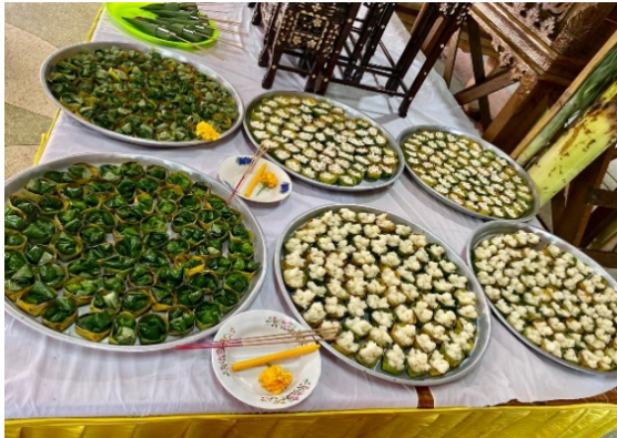
ภาพที่ ๔ ข้าวพันก้อน ข้าวตอก และเมี่ยงที่จัดไว้ในถาด

๑.๒.๒.๕ เมื่อปั้นข้าวพันก้อน ทำข้าวตอกและเมี่ยง เสร็จแล้ว จะนำไปวางบนโต๊ะหน้าธรรมมาสน์ เพื่อใช้ในการประกอบพิธีแห่ข้าวพันก้อน