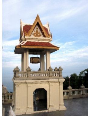
ภาพหอกลองในงานจิตรกรรม

ในภาพจะเห็นหอกลองอยู่ด้านหลังพระราชวัง หอกลอง คืออาคารประเภทหนึ่งในงานสถาปัตยกรรมไทยซึ่งก่อสร้างในวัด บางแห่งใช้เป็นอาคารสำหรับแขวนกลองเพื่อใช้ตีบอกสัญญาณ เวลาแก่พระสงฆ์ในการลงทำวัตรและประกอบกิจของสงฆ์ ในสมัยโบราณมีการใช้ประโยชน์จากกลองเป็นอย่างมาก ตั้งแต่ระดับกลุ่มชน ในฐานะเครื่องดนตรี กองทัพ ในฐานะกลองศึก และบ้านเมืองในฐานะที่ใช้ตีบอกสัญญาณต่าง ๆ ในความเป็นอยู่ประจำวัน แม้แต่วัดในพระพุทธศาสนา ก็ใช้ประโยชน์จากสัญญาณการตีกลอง ในการปฏิบัติกิจประจำวัน ในสมัยกรุงศรีอยุธยา มีการสร้างหอกลองประจำเมือง โดยให้อยู่ในความควบคุมดูแลของกรมพระนครบาล ลักษณะของหอกลองเป็นหอกสูงสามชั้น สร้างด้วยไม้สูง ๑ เส้น ๑๐ วา หลังคาเป็นทรงยอดสูง(หอกลอง, ๒๕๖๔, ออนไลน์)