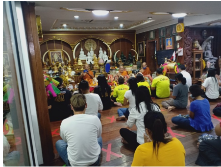
ภาพที่ ๘ ผู้เข้าร่วมพิธีเสริมเรือ