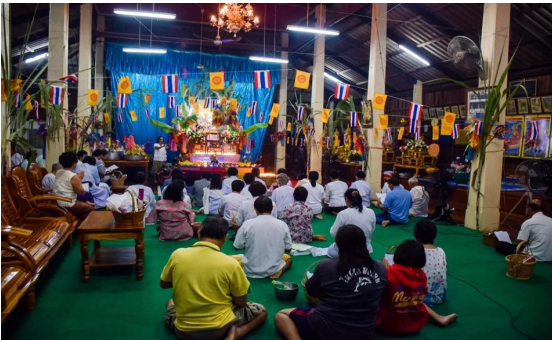
ภาพที่ ๑๒ การเทศน์มาลัยหมื่น มาลัยแสน

“สุระหิตัง นิจจังตังตัง ธัมมัง วันทามิ ข้าไหว้บาทนาโถ กับทั้งพระศรีมหาโพธิกุศลโลตมวลมามีอิตราข้าไหว้นับได้ด้วยโกฏิ เทพพระมาลัยโปรดปรานี ตั้งไว้ตบเศร้าข้ากราบเศียรเกล้าวันทา ด้วยมาลาตวงดอกพร้อมด้วยข้าวตอกบรรณาการทั้งข้าวเปลือกข้าวสารผายแผ่ บูชาแก่ให้สัพพัญญู องค์พุทธโธผู้ประเสริฐอัคคะเลิศองค์พระธรรม สังฆมนำขาด ตามโอวาทคำสอน ชินาวารองค์ประเสริฐสมมุติสงฆ์เลิศทรงธรรม พวกข้าน้อมนำมาพร้าพร้อมน้อมกายและอินทรีย์จิตยินดีประมาท ฟังโอวาทคำสอน ในบวรพุทธศาสน์ ด้วยบาทพระคาถาว่าโยโส สุนทะหิตังธัมมัง ะรัง สักกัจจัง อารานัง กะโรมะ”