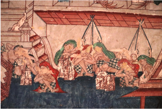
ทหารรักษาวัง นุ่งผ้าโสร่งตาหมากรุก ไม่สวมเสื้อ มีผ้าคลุมศีรษะ กำลังหลับ ภาพการวางปิ่นยาวและตะเกียง