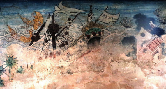
ภาพสำเภาจีนในงานจิตรกรรม

ในงานจิตรกรรมจะปรากฏภาพสำเภาจีนในทศชาติชาดก ตอนมหาชนกชาดก จิตรกรพยายามเขียนอักษรจีนไว้บนใบของสำเภา