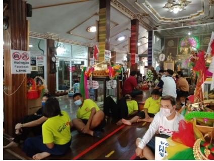
ภาพที่ ๑ การจัดเตรียมสถานที่ประกอบพิธี

การจัดเตรียมสถานที่ สำหรับประกอบพิธีของวัดพุน้อยได้จัดขึ้น ขึ้นที่บนศาลาสำหรับทำพิธีโดยเฉพาะ เพราะมีขนาดกว้างขวางเพียงพอที่ผู้เข้าร่วมพิธีจะนั่ง ประกอบพิธีได้