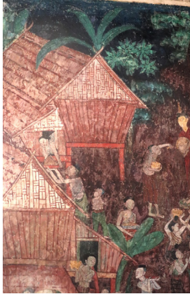
ภาพความเป็นอยู่ของไทยวน

จิตรกรได้สอดแทรกวัฒนธรรมความเป็นอยู่ของไทยวนหรือชาวโยนกไว้ในงานจิตรกรรมตอนโปรดชาวบ้านและชฎิลสามพี่น้อง ได้แก่ สถาปัตยกรรมพื้นบ้าน เป็นที่อยู่ของไทยวนเส้าให้สระบุรี รวมถึง วัฒนธรรมของไทยวนอีกหลายด้านเช่นการแต่งกาย ทรงผม ประเพณีวิถีชีวิต เป็นต้น จะขออธิบายถึงชาวไทยวนดังนี้ ชนกลุ่มไทยวน เป็นชนกลุ่มหนึ่งที่มีภาษาพูด และวัฒนธรรม ที่อพยพมาจากภาคเหนือ เมืองเชียงแสน ชนกลุ่มนี้อาศัยอยู่ที่อำเภอเส้าให้ จังหวัดสระบุรี ชาวไทยวนจะตั้งหมู่บ้านเรียงไปตามริมแม่น้ำป่าสักทั้งสองฟากฝั่ง