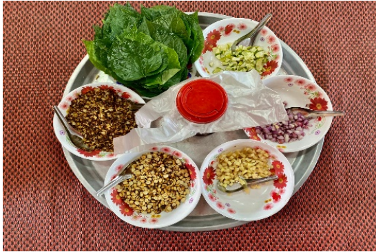
ภาพที่ ๓ การทำเมี่ยงห่อใบชะพลู

๑.๒.๒.๔ มีการทำเมี่ยงเพื่อใช้ประกอบพิธีแห่ข้าวพันก้อน