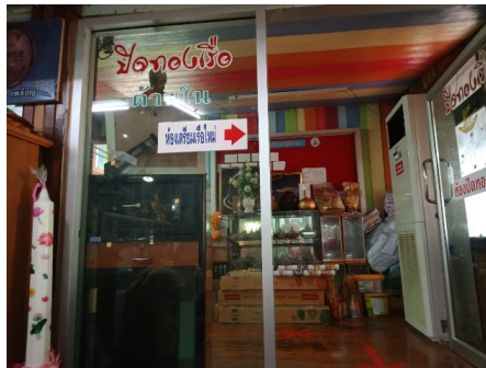
ภาพที่ ๒ ห้องสำหรับเตรียมเรือใหม่

สำหรับผู้ที่มาทำพิธียกเครื่องครั้งแรกนั้นจะมีการจัดเตรียมห้องไว้ให้ เตรียมเรือใหม่ก่อนที่จะเข้าร่วมพิธีก่อนด้วย ซึ่งหลังจากอบรมเตรียมความพร้อมเสร็จแล้ว ผู้ที่มาทำพิธีจะต้องมาจัดเตรียมเรือใหม่ที่ห้องนี้ก่อนทุกครั้ง (พระโสภณพัฒนคุณ, ๒๕๖๓)