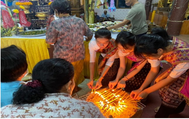
ภาพที่ ๑๑ การวางเทียนลงบนกระถางน้ำมันต์

๑.๒.๓.๖ เมื่อเสร็จพิธีการแห่ขบวนข้าวพันก้อน จะนำเทียนมาวางลงบนกระถางน้ำมันต์