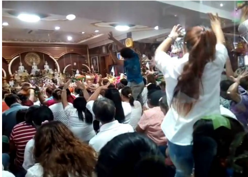
ภาพที่ ๖ ผู้เข้าร่วมพิธีบางคนลุกขึ้นมาร่ายรำ