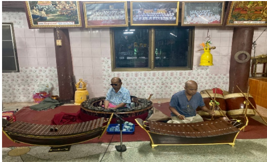
ภาพที่ ๘ ดนตรีที่ใช้ประกอบในพิธี

๑.๒.๓.๔ มีดนตรีบรรเลงประกอบในพิธีการแห่ข้าวพันก้อน คือ ระนาดและซออู้