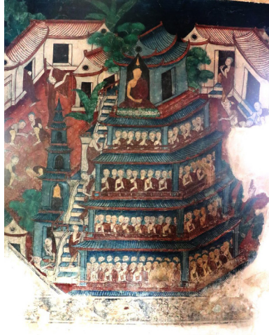
ภาพปริศนาธรรม

ในภาพจิตรกรรมภาพนี้ไม่ได้สื่อถึงพุทธประวัติตอนใด ซึ่งผู้เขียนได้ตีความว่างานจิตรกรรมฝาผนังนั้นมีวัตถุประสงค์เพื่อสั่งสอนธรรมทั้งพระภิกษุ และฆราวาส ในภาพแสดงอาคารมีสี่ชั้นมีพระภิกษุนั่งอยู่เต็มทุกชั้นเรียงจากมากไปหาน้อย ชั้นล่างจะมีจำนวนภิกษุมากและค่อยๆลดจำนวนลงในแต่ละชั้น ชั้นบนสุดเป็นภาพพระพุทธเจ้าประทับอยู่พระองค์เดียวในแต่ละชั้นจะมีบันไดทางขึ้นอยู่ด้านนอกมีภิกษุกำลัง ปีนบันไดขึ้นไปด้านบน มีพระภิกษุอีกจำนวนหนึ่งที่อยู่นอกอาคารไม่สนใจฟังธรรมหรือปฏิบัติดังเช่นภิกษุที่อยู่ในอาคาร