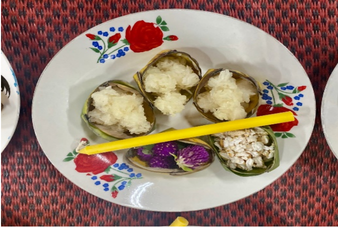
ภาพที่ ๑ ข้าวพุ้นก้อนที่จัดใส่ไว้ในจาน

๑.๒.๒.๒ นำข้าวเหนียวมาปั้นเป็นก้อนกลม ๆ ใส่ให้เต็มกระทง แล้วนำกระทงที่ใส่ข้าวเหนียวเสิร์ฟจสมบูรณ์มาวางเรียงใส่ในจาน ๓ กระทง