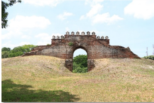
ภาพที่ ๔.๗ ประตูเพนียด