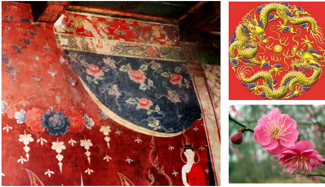
ภาพมังกรและดอกเหมย

ในงานจิตรกรรมมีภาพอันเป็นมงคลที่เป็นสัญลักษณ์ของจีนอยู่หลายภาพ เช่น มังกร ดอกเหมย ดอกท้อ เป็นต้น