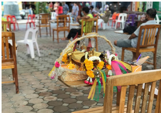
ภาพที่ ๙ เรือที่นำมาเสริม