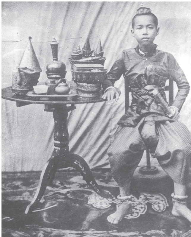
พระพุทธเจ้าหลวง เมื่อดำรงพระยศเป็นสมเด็จพระเจ้าลูกยาเธอ เจ้าฟ้าจุฬาลงกรณ์

แผนที่ต่าง ๆ เช่น แผนที่แพที่ประทับแรมท้องพรหมาสตร์ แผนที่พระที่นั่งเย็น แผนที่เพนียด แผนที่สระน้ำสง สระน้ำเสวย เป็นต้น จัดเป็นข้อมูลปฐมภูมิที่สำคัญยิ่งสำหรับการศึกษาประวัติศาสตร์ โบราณคดี คติชนวิทยาของเมืองลพบุรีเมื่อกว่าหนึ่งศตวรรษก่อน การเสด็จประพาสเมืองลพบุรีครั้งที่สองนี้ เสด็จในเดือน ๑๒ ซึ่งเป็นฤดูน้ำหลากอีกเช่นกัน