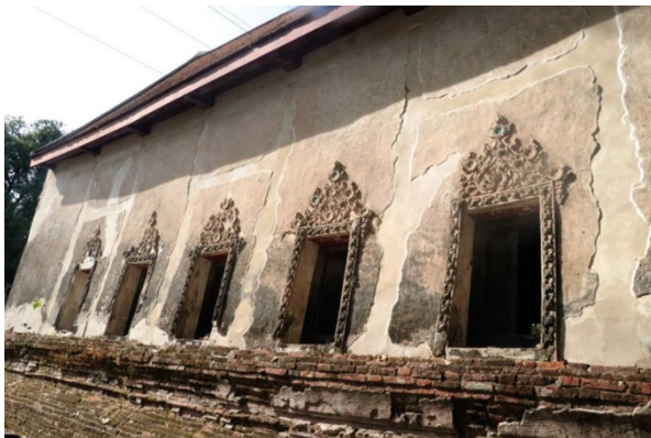
ภาพผนังด้านข้างฉาบเรียบ เจาะเป็นช่องหน้าต่าง ด้านละ ๕ ช่อง ชும்หน้าต่าง ประดับปูนปั้นลวดลายพฤกษชาติ และถ้วยชามสังคโลก นำเสียดายที่ถ้วยสังคโลกถูกจัดขโมยไปขาย จนเหลือให้ชมไม่มากนัก