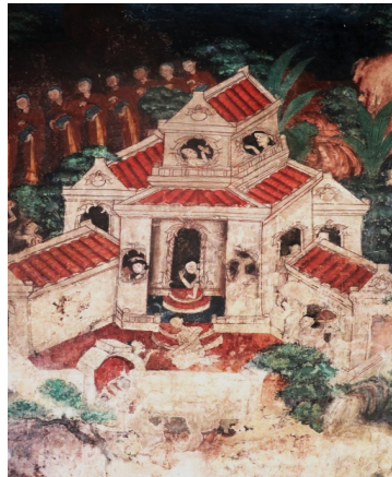
ภาพสถาปัตยกรรมแบบจีน ในงานจิตรกรรม