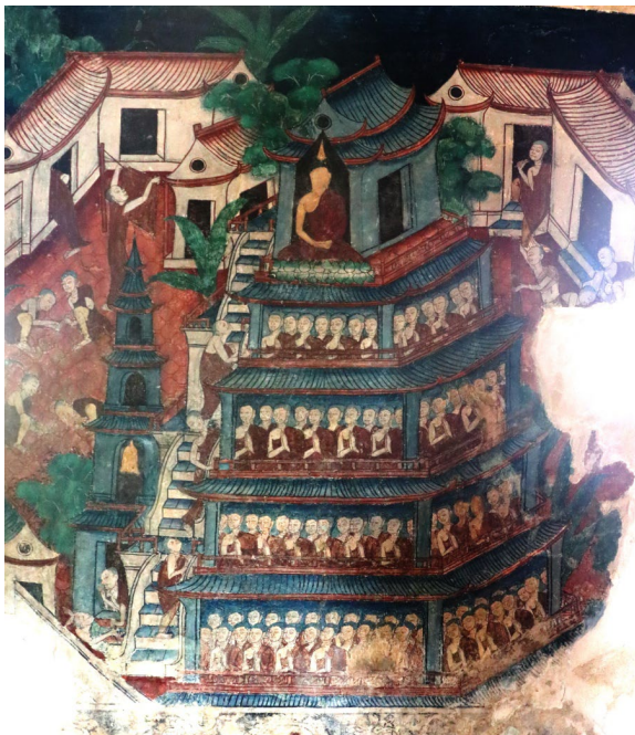
ภาพปริศนาธรรม