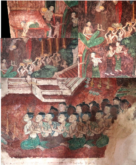
ประเพณีวิถีชีวิตการทำบุญตักบาตรและทรงผม