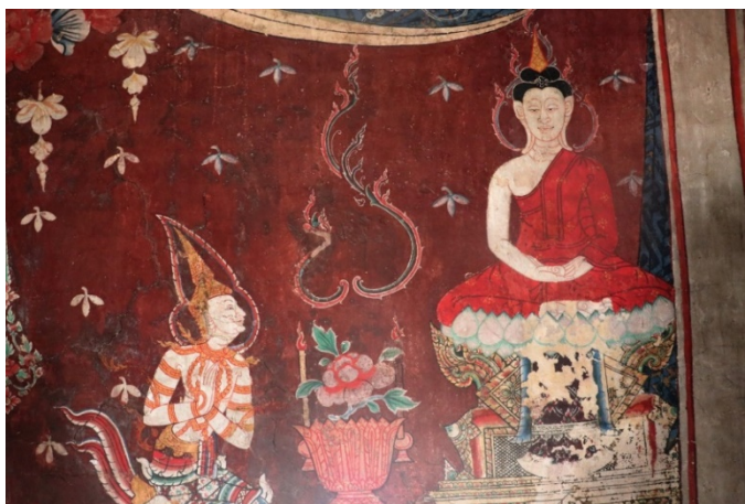
ภาพพระพุทธเจ้าประทับนั่งสมาธิบนดอกบัวบานฐานสิงห์ เทวดาฟังธรรม สัตว์ส่วนและการตัดเส้นงดงาม

ภาพด้านขวามือพระประธานจะแบ่งภาพออกเป็น ๒ ส่วน คือบริเวณ คอสองหรือส่วนบนเหนือขอบหน้าต่างเป็นภาพมาลัยดอกไม้คล้ายดอก พุดตาน ดูแปลกตาสวยงามไม่เหมือนจิตรกรรมฝาผนังโดยทั่วไป พื้นผนัง สีแดงเข้ม ดอกไม้เป็นสีชมพู น้ำเงินและสีขาว ดอกไม้ร่วงและเทพชุมนุม หันหน้ามาหาพระพุทธเจ้าที่มุมขวาสุด เนื้อพระพุทธเจ้าเขียนเป็นผ้า幔 มีลวดลายผ้าศิลปะแบบจีน มีภาพมังกรหันหน้าชนกันสองตัว