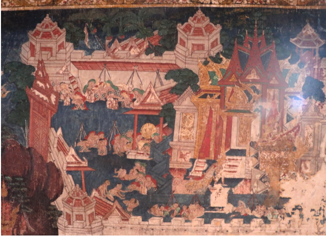
ภาพซุ้มประตูพระบรมมหาราชวัง และป้อมปราการในงานจิตรกรรม

จิตรกรได้นำรูปแบบพระบรมมหาราชวังในกรุงเทพมหานครมาถ่ายทอดไว้ในงานจิตรกรรมสื่อให้เห็นถึงสถาปัตยกรรมความรุ่งเรืองของไทยยุคต้นกรุงรัตนโกสินทร์