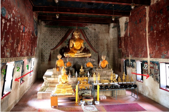
การดูภาพจิตรกรรมต้องดูจากภาพในสุดย้อนกลับมาที่ประตูทางเข้า