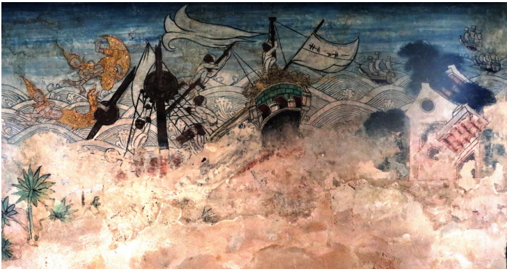
ภาพสำเภาจีนในงานจิตรกรรม

ในงานจิตรกรรมจะปรากฏภาพสำเภาจีนในทศชาติชาดก ตอนมหาชนกชาดก จิตรกรพยายามเขียนอักษรจีนไว้บนใบของสำเภา