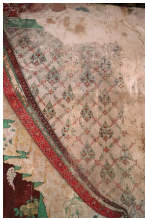
ภาพลายพุ่มข้าวบิณฑ์ ลายผ้าพิมพ์ลาย ดอกไม้ และผลไม้