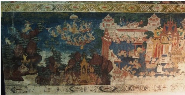
ภาพมหากาพย์เนกกรมณ์

เนื้อหาของภาพคือ เมื่อเจ้าชายสิทธัตถะเสด็จออกจากวัง พร้อมด้วยนายฉันทะและม้ากัณฐกะ เมื่อเสด็จมาถึงฝั่งแม่น้ำเนรัญชรา พระองค์ก็ทรงเปลื้องเครื่องทรงกษัตริย์ มอบให้นายฉันทะ และรับสั่งให้นำม้ากัณฐกะกลับคืนสู่พระนคร เพื่อแจ้งข่าวแก่พระประยูรญาติและพระราชบิดาก่อนจากไป นายฉันทะและม้ากัณฐกะ ได้แสดงความโศกเศร้าโศกาอาดูรด้วยความจงรักภักดีและอาลัยรัก