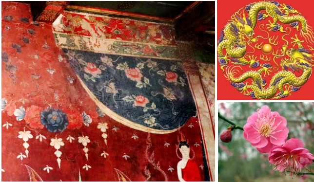
ภาพมังกรและดอกเหมย

ในงานจิตรกรรมมีภาพอันเป็นมงคลที่เป็นสัญลักษณ์ของจีนอยู่หลายภาพ เช่น มังกร ดอกเหมย ดอกท้อ เป็นต้น