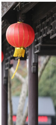
ภาพโคมไฟแบบจีน