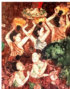
ทรงผมโขงโขดงในงานจิตรกรรม

ทรงผมของหญิงไทยสมัยโบราณ ซึ่งรวบเข้าไปเกล้าไว้บนขม่อมเป็นห่วงยาว ๆ โดยมากมีเกี้ยวหรือพวงมาลัยสวม เรียกโขงโขดง โองโขดง ก็ว่า ทรงนี้มีมาตั้งแต่สมัยสุโขทัย ทั้งหญิงและชายจะไว้ผมทรงเดียวกัน คือ การไว้ผมยาวแล้วเกล้าเป็นมวยอยู่กลางศีรษะ พร้อมกับมัดเกล้าให้เป็นห่วงยาว ๆ มีเกี้ยวหรือพวงมาลัยสวม โดยสันนิษฐานว่าเหตุการณ์บ้านเมืองในยุคนั้น อยู่ในช่วงร่มเย็นเป็นสุข ในน้ำมีปลา ในนามีข้าว ไฟฟ้าหน้าใส ผู้หญิงไทยจึงไว้ผมมวยเกล้า (ผมทรงโขงโขดง. ๒๕๖๓. ออนไลน์)