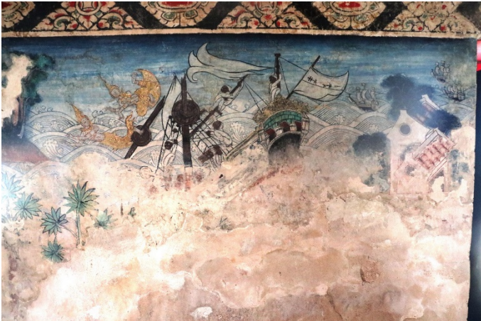
ช่องที่ ๒ มหาชนกชาดก