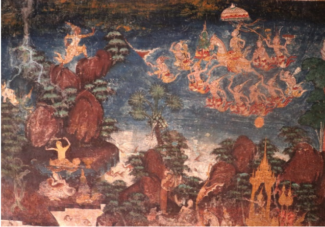
ภาพมหากาพย์รามเกียรติ์ ล่างขวา ทรงเสด็จออกนอกเมืองทอดพระเนตรเห็นทนต์ทั้งสี่ คือคนแก่ คนเจ็บ คนตาย และสมณะ ช้ายทรงตัดพระเมาลีริมฝั่งแม่น้ำอโนมา