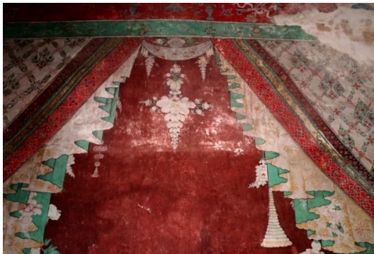
ภาพลายผ้าม่านหลังพระประธาน

ลูกท้อ ส่วนลายผ้ามานั้นเป็นลายพุ่มข้าวบิณฑ์ก้านแย่งแบบไทย เน้นสีเขียว และสีแดง จิตรกรรมด้านหลังพระประธานนี้มีความแปลกตาต่างจากการเขียนภาพจิตรกรรมฝาผนังแบบประเพณีดั้งเดิมโดยทั่วไป ที่ต้องเขียนภาพไตรภูมิ แต่ที่วัดจันทบุรี จิตรกรกลับออกแบบให้เป็นภาพม่านแหวก อาจต้องการแสดงให้เห็นถึงวัฒนธรรมจีนและตะวันตกที่เข้ามามีบทบาทในสมัยนั้น