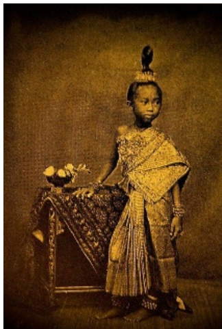
ทรงผมของหญิงไทยสมัยโบราณและหญิงชาวเหนือ

ทรงผมของหญิงไทยสมัยโบราณ ซึ่งรวบเข้าไปเกล้าไว้บนขม่อมเป็นห่วงยาว ๆ โดยมากมีเกี้ยวหรือพวงมาลัยสวม เรียกโขงโขดง โองโขดง ก็ว่า ทรงนี้มีมาตั้งแต่สมัยสุโขทัย ทั้งหญิงและชายจะไว้ผมทรงเดียวกัน คือ การไว้ผมยาวแล้วเกล้าเป็นมวยอยู่กลางศีรษะ พร้อมกับมัดเกล้าให้เป็นห่วงยาว ๆ มีเกี้ยวหรือพวงมาลัยสวม โดยสันนิษฐานว่าเหตุการณ์บ้านเมืองในยุคนั้น อยู่ในช่วงร่มเย็นเป็นสุข ในน้ำมีปลา ในนามีข้าว ไฟฟ้าหน้าใส ผู้หญิงไทยจึงไว้ผมมวยเกล้า (ผมทรงโขงโขดง. ๒๕๖๓. ออนไลน์)