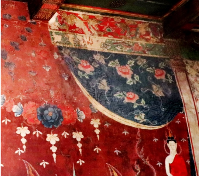
ภาพมังกรด้านบนสุดและลายดอกไม้คล้ายดอกเหมย อิทธิพลศิลปะแบบจีน