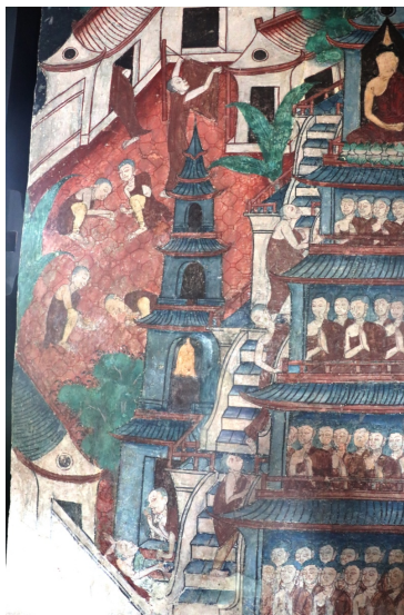
ภาพปริศนาธรรม

เมื่อบรรลุเป็นพระอรหันต์ หากสิ้นชีวิตแล้วจะไม่เกิดอีก (พระอริยบุคคล. ๒๕๖๓. ออนไลน์)