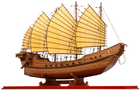
ภาพเรือสำเภาจีนจำลอง

ในอดีตเรือสำเภาจีนคือ ราชนิแห่งท้องทะเล เป็นจุดเริ่มต้นของ การค้าขาย การเดินทาง รวมถึงการเผยแพร่ อารยธรรม ในสมัยก่อนจะใช้เรือสำเภาบรรทุกสินค้ามีค่า เช่น ผ้าไหม ทองคำ หยก เครื่องลายคราม โดยบรรทุกสินค้ามีค่าเหล่านี้ไว้ที่ใต้ท้องเรือ (สำเภาจีน. ๒๕๖๔. ออนไลน์)