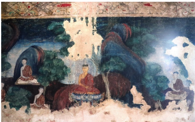
ภาพแรก จากด้านในสุดเป็นภาพพระพุทธรเจ้า ประทับนั่งสมาธิบนบัลลังก์บัวหงาย มีพระสาวกนั่งสมาธิอยู่ใต้ต้นไม้และโขดหิน

อาคารเครื่องก่อแบบจีน ภาพพระพุทธรองค์ประทับอยู่ที่ชั้นบนสุดของเรือน ซ้อนชั้น ชั้นล่างมีเหล่าพระสาวกนั่งฟังธรรม ฉากอาคารเป็นสถาปัตยกรรม ทรงเก๋งจีน บันไดทางขึ้นอยู่ภายนอก ด้านข้างเป็นหอระฆัง กำแพง และ อาคารสถาปัตยกรรมแบบจีน อาจเป็นภาพปริศนาธรรม ภาพพระพุทธรเจ้า ออกโปรดชาวบ้านและชฎิลสามพี่น้องเป็นภาพสุดท้ายที่มีขนาดใหญ่ที่สุด การดูภาพให้ดูจากภาพในสุดย้อนกลับมาที่ประตูทางเข้า ภาพทุกภาพ ลบเลือนเสียหายช่วงล่างของภาพเนื่องจากความชื้น จากหลังคารั่ว