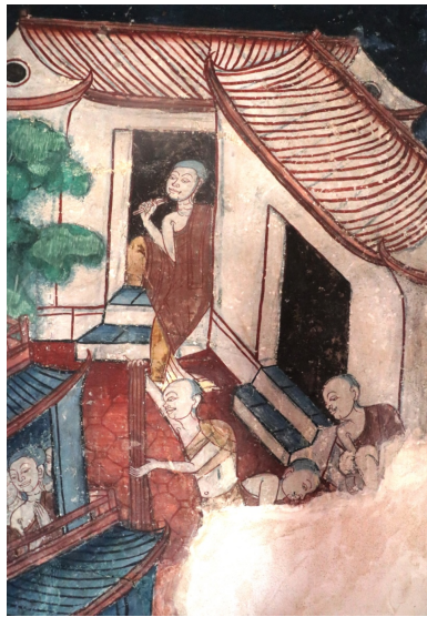
ภาพการแต่งกายของพระภิกษุซึ่งแตกต่างจากพระภิกษุไทย