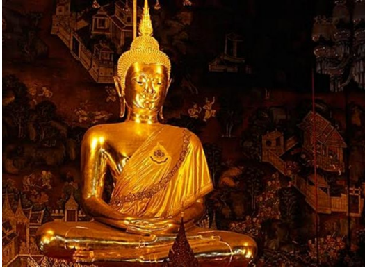
ภาพพระพุทธโสธรจังหวัดฉะเชิงเทรา