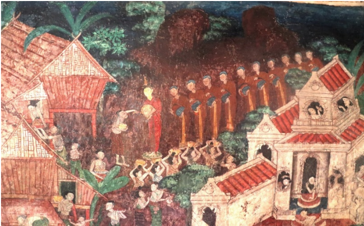
ภาพพระพุทธเจ้าออกโปรดชาวบ้านนอกเมือง