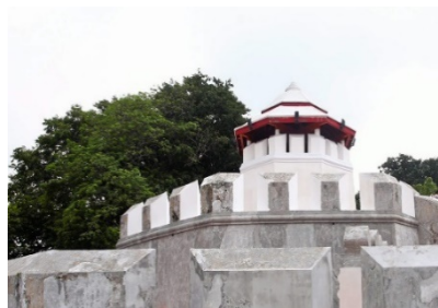
ภาพซุ้มประตู พระบรมมหาราชวังและป้อมปราการ