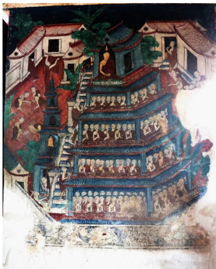
ภาพที่สาม ปรีศนาธรรม พระพุทธเจ้าประทับอยู่ที่ชั้นบนอาคารแบบจีน ชั้นล่างมีเหล่าพระ สาวกนั่งอยู่เต็ม ทุกชั้น อาคารเป็นสถาปัตยกรรมแบบจีน บ้านโดทางขึ้นอยู่ภายนอก