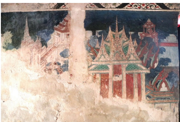
ช่องที่ ๕ ภาพมโหสถขาดก

ช่องที่ ๔ ภาพเนมิราชขาดก เป็นชาติที่ ๔ ของทศชาติขาดก พระโพธิสัตว์เสวยพระชาติเป็นพระเนมิราช โอรสเจ้าเมืองมิลิลา โปรดการ บริจาคทานและรักษาพรหมจรรย์ พระอินทร์ทรงพอพระทัย ถึงกับให้ พระมาตุลีนำทิพยรถมารับไปเที่ยวเมืองสวรรค์ และเมืองนรก แล้วเชิญให้ ครองเมืองสวรรค์ พระเนมิราชไม่ทรงรับและเสด็จกลับบ้านเมือง