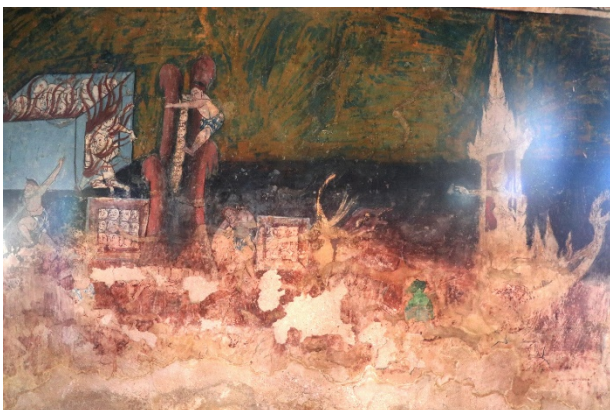
ช่องที่ ๔ ภาพเนมิราชขาดก

ช่องที่ ๔ ภาพเนมิราชขาดก เป็นชาติที่ ๔ ของทศชาติขาดก พระโพธิสัตว์เสวยพระชาติเป็นพระเนมิราช โอรสเจ้าเมืองมิลิลา โปรดการ บริจาคทานและรักษาพรหมจรรย์ พระอินทร์ทรงพอพระทัย ถึงกับให้ พระมาตุลีนำทิพยรถมารับไปเที่ยวเมืองสวรรค์ และเมืองนรก แล้วเชิญให้ ครองเมืองสวรรค์ พระเนมิราชไม่ทรงรับและเสด็จกลับบ้านเมือง