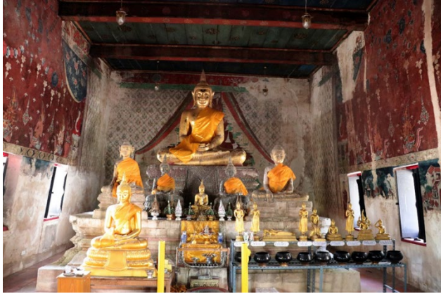
ภาพพระประธานในอุโบสถปางสมาธิมีพุทธรูปปางมารวิชัยขนาดช้ายขวา และพระปางสมาธิขนาดย่อมอีก ๒ องค์