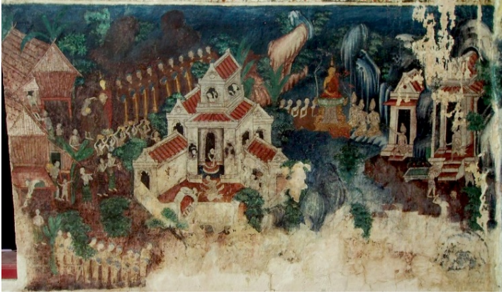
ภาพที่สี่ พระพุทธเจ้าออกโปรดชาวบ้านและชฎิลสามพี่น้องเป็นภาพสุดท้ายที่มีขนาดใหญ่ที่สุด