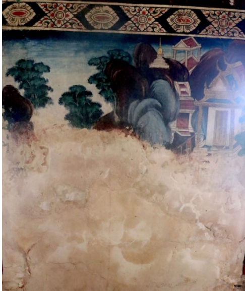
ช่องที่ ๓ ภาพสุวรรณสามชาดก

ช่องที่ ๒ มหาชนกชาดก เป็นชาติที่ ๒ ของทศชาติชาดก ขณะที่เสด็จ ลงสำเภาไปค้าขาย เกิดพายุใหญ่เรือแตกกลางมหาสมุทร พระมหาชนก ทรงว่ายน้ำได้คลื่นอยู่ในมหาสมุทรถึง ๗ วัน นางเมขลาเห็นเลื่อมใส ในความพยายาม จึงอุ้มพระองค์เหาะไปส่งที่ฝั่ง