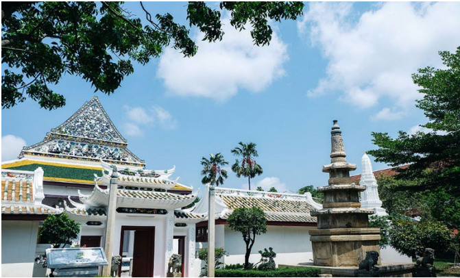
วัดราชโอรสารามราชวรวิหาร

ภาพอาคารสถาปัตยกรรมที่แสดงให้เห็นการรับอิทธิพลจากจีน เพราะในยุคนั้นการค้าขายกับชาวจีนกำลังเฟื่องฟู ในงานจิตรกรรมเป็นอาคารสองชั้นมุงด้วยกระเบื้องเคลือบ อาจหมายถึงวัดหรือที่อยู่ของชนชั้นสูงที่มีฐานะเป็นที่พักซึ่งเป็นรูปแบบนิยมในสมัยรัชกาลที่ ๓ ดังจะเห็นได้จากวัดวาอารามสมัยรัชกาลที่ ๓ ที่นิยมสร้างแบบศิลปะจีน เช่น วัดราชโอรสารามราชวรวิหาร เป็นต้น