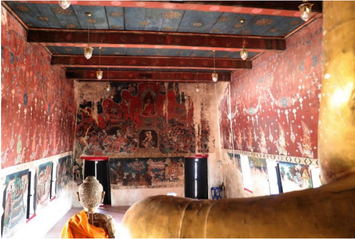
ภาพจิตรกรรมตรงข้ามพระประธาน