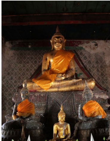
ภาพพระประธานในอุโบสถปางสมาธิมีพุทธลักษณะคล้ายกับ พระพุทธโสธร จังหวัดฉะเชิงเทราที่เป็นศิลปะแบบลาว