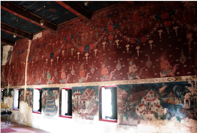
ภาพจิตรกรรมด้านซ้ายมือของพระประธาน

ภาพด้านซ้ายมือพระประธานจะแบ่งภาพออกเป็น ๒ ส่วน คือ บริเวณคอสองหรือส่วนบนเหนือขอบหน้าต่างด้านในสุดเป็นภาพพระพุทธเจ้านั่งประทับขัดสมาธิบนดอกบัว ด้านบนสุดเขียนภาพเพื่อองูบะดอกไม้ ถัดมาเป็นภาพเทพชุมนุม คั่นด้วยพุ่มข้าวบิณฑ์ ด้านล่างสุดช่องระหว่างหน้าต่างเขียนภาพพุทธประวัติ ตอนพระอินทร์และพระพรหมทูลเชิญ ขอให้พระพุทธเจ้าเสด็จไปเทศนาโปรดเหล่าเทวดาบนสวรรค์ ฉากในภาพแสดง