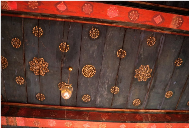
ภาพจิตรกรรมบนเพดานเป็นภาพดาวล้อมเดือน

เพดานเป็นพื้นสีดำปิดทองคำเปลว บริเวณช่อทาสีแดง ปิดทอง เป็นภาพดาวล้อมเดือนซึ่งเป็นลวดลายที่นิยมมาตั้งแต่สมัยอยุธยา ลวดลาย อาจจะเป็นภาพเขียนสี หรืออาจทำด้วยไม้แกะสลักเป็นรูปดาวมีรัศมี บนเพดานหรือฝ้าเพดาน พระอุโบสถหรือวิหาร ที่มักจะทาฝ้าเพดานที่ทำด้วย ไม้ นั้นเป็นพื้นสีแดง และทาสีดาวเป็นสีทอง การประดับตกแต่งฝ้าเพดาน ในลักษณะรูปดาวก็คือ สัญลักษณ์ที่มีคติความเชื่อทางคติของฝ่ายเถรวาท ที่แสดงว่า พื้นที่อยู่ในพระอุโบสถหรือในพระวิหาร ก็คือ พื้นของสวรรค์ ในชั้นฟ้า ที่อยู่ใกล้กับดวงดาว