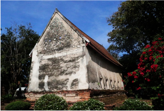
ภาพอุโบสถด้านด้านหลังผนังฉาบเรียบไม่มีประตู