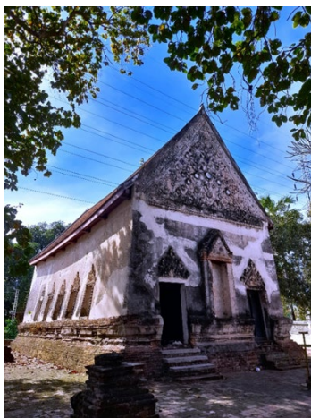
ภาพอุโบสถของวัดจันทบุรีมีด้านหน้าเป็นทรงสอบ คือฐานกว้างยอดเรียวเล็กกลมมีซุ้มบันแถลงตรงกลาง

ดูจากลักษณะรูปแบบและลวดลายการตกแต่งคล้ายกับวัดในกรุงเทพฯ หลายวัดเช่น วัดสามพระยา ที่ประดับสัญลักษณ์มงคลบนหน้าบันพระอุโบสถ ได้สะท้อนให้เห็นอิทธิพลศิลปะจีนที่เข้ามามีบทบาทในงานศิลปกรรม ในรัชสมัยพระบาทสมเด็จพระนั่งเกล้าเจ้าอยู่หัว เนื่องจากในรัชสมัยดังกล่าว มีการติดต่อค้าขายกับพ่อค้าจีนในย่านการค้าของไทยอย่างเฟื่องฟู ประกอบ กับผู้สร้างพระอารามซึ่งอยู่ในฐานะชนชั้นปกครองและมีบทบาทในทาง การค้าระหว่างประเทศ และเป็นกลุ่มผู้กำหนดกระแสความนิยมงาน ศิลปกรรมอย่างใหม่ แขนงงานศิลปะแบบไทยประเพณีที่มีมาแต่เดิม ดังนั้น การประดับตกแต่งลายสัญลักษณ์มงคลจีนในงานศิลปกรรมไทย จึงเป็น การรับเอาคติความเชื่อจีนมาประดับตกแต่งพุทธศาสนสถาน ให้เกิดความ เป็นสิริมงคลและเป็นการให้คำอวยพรให้เกิดความสงบสุขแก่บ้านเมือง (ลลิตา อัสวสกุลลือชา. ๒๕๖๓. ออนไลน์) ยกตัวอย่างเช่น วัดไพชยนต์พล เสพย์ เจริญรุ่งเรืองในสมัยรัชกาลที่ ๓