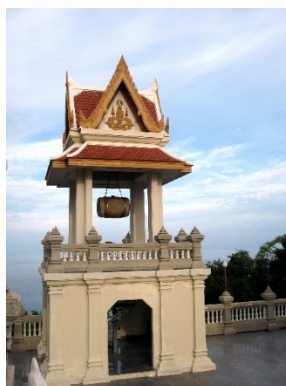
ภาพหอกกลองในงานจิตรกรรม