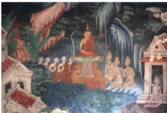
ภาพพระพุทธรูปเจ้าเสด็จไปโปรด ชฎิล ๓ พี่น้อง

เนื้อหาของภาพพระพุทธรูปองค์เสด็จไปถึงตำบลอุรุเวลาเสนานิคม ซึ่งเป็นที่อยู่อาศัยของชฎิล ๓ พี่น้อง กับหมู่ศิษย์ ๑,๐๐๐ คน ที่ชายชื่อ อุรุเวลกัสสปะ น้องชายคนกลางชื่อ นทีกัสสปะ น้องชายน้อยชื่อ คยาก็ัสสปะ ทั้ง ๓ แยกกันสร้างอาศรมอยู่กับบริวารของตนใกล้ฝั่งแม่น้ำเนรัญชา พระองค์ทรง ทรมานอุรุเวลกัสสปะด้วยวิธีต่าง ๆ แสดงให้เห็นว่าลัทธินั้นไม่มีแก่นสาร จนอุรุเวลกัสสปะสลดใจ พร้อมทั้งบริวารลอยผมที่เกล้าเป็นชฎา และเครื่อง บริหารบำเพ็ญพรตและบูชาไฟเสียในแม่น้ำ ทูลขออุปสมบท พระองค์ทรง ประทานให้ ส่วนน้องชายคนที่ ๒ ตั้งอาศรมอยู่ทางใต้กระแสน้ำ ได้เห็นชฎา และบริวารเครื่องบำเพ็ญพรตบูชาไฟ ของพี่ชายลอยไปตามกระแสน้ำเช่นนั้น คิดว่าเกิดอันตรายแก่พี่ชายจึงพาบริวาร ๓๐๐ คนมาสู่สำนักพี่ชาย ก็ได้เห็น พี่ชายถือเพศเป็นภิกษุเสียแล้ว ถ้ามได้ความว่าเป็นพรหมจรรย์อันประเสริฐ จึงพร้อมทั้งบริวารลอยบริวารทิ้งเสีย แล้วทูลขออุปสมบท ฝ่ายคยาก็ัสสปะ เห็นบริวารของพี่ชายลอยไปตามกระแสน้ำจึงคิดเช่นนั้นอีก แล้วพาบริวาร ๒๐๐ คน ไปสู่สำนักของพี่ชาย ก็เห็นพี่ชายทั้ง ๒ ถือเพศเป็นภิกษุเสียแล้ว ถ้ามก็ได้ความว่าเป็นพรหมจรรย์อันประเสริฐหลังได้ขออุปสมบท