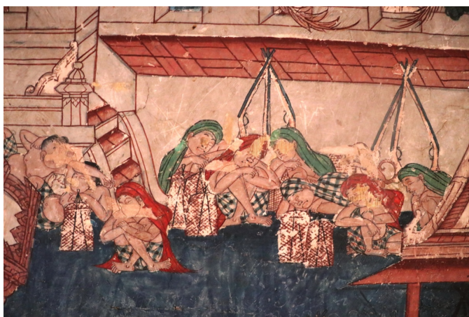
ภาพทหารรักษาวัง นุ่งผ้าโสร่งตาทามากรุก ไม่สวมเสื้อ มีผ้าคลุมศีรษะ กำลังหลับ ภาพการวางปืนยาวและตะเกียง