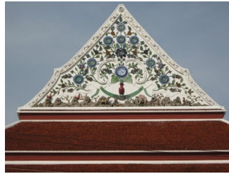
ภาพซ้ายหน้าบ้านที่ไม่มีช่องฟ้าโบระกาทางหงส์ ประดับลายปูนปั้นลายพรรณพฤกษาและใช้ถ้วยสังคโลกตกแต่ง เปรียบเทียบกับขวาวัดไพชยนต์พลเสพย์ ศิลปกรรมสมัยรัชกาลที่ ๓