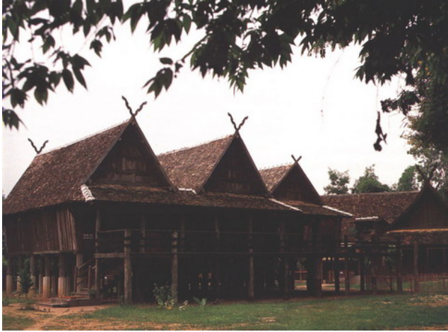
ภาพบ้านเรือนที่อยู่อาศัยชาวไทยวน