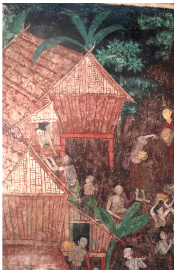
ภาพความเป็นอยู่ของไทยวน