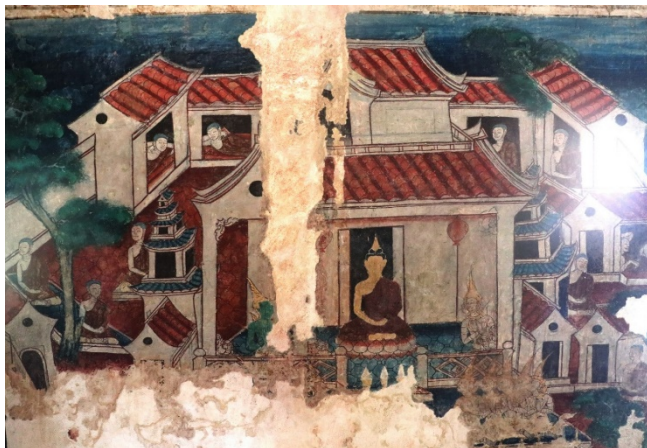
ภาพที่สอง พระอินทร์และพระพรหมเหล่าเทวดาฟังธรรมพระพุทธเจ้า ในอาคารสถาปัตยกรรมแบบจีน