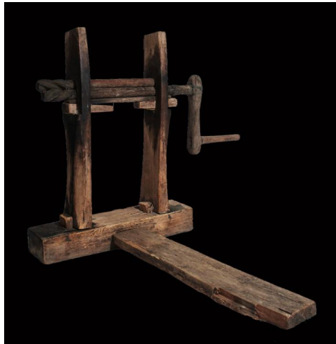
ภาพประกอบ ๔๑ อี้ว์ ของลาวแวงบ้านหนองเมือง

๓.๔ อี้ว์ฝ้าย เป็นเครื่องมือคัดแยกเมล็ดดอกจากปุ๋ยฝ้ายที่แห่งสนิท ดีแล้ว