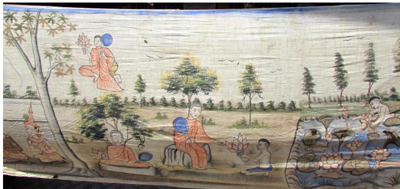
ภาพประกอบ ๕๒ ภาพจิตรกรรมบนผืนผ้า ของลาวแจ้วบ้านหนองเมือง