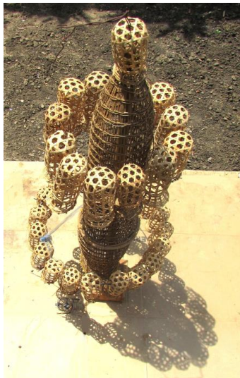
ภาพประกอบ ๑๓ กวัก ของลุง สุวรรณ ประกอบการ

๑.๘ กวัก ทำจากไม้ไผ่สานคล้ายชะลอมทรงสูงขนาดเล็กส่วนขอบ ปากจะสานให้บานออกเล็กน้อย