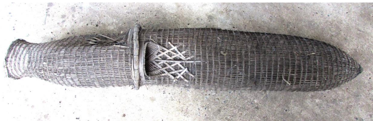
ภาพประกอบ ๑๑ ไซ ของลาวแก้งหนองเมือง

๑.๗ ไซ เป็นเครื่องมือดักสัตว์น้ำ ส่วนใหญ่จะดักปลาในกลุ่มปลาเล็กปลาน้อย ใช้งานในแหล่งน้ำไม่ลึก เป็นแหล่งน้ำไหลและเป็นการเปิดช่องระบายน้ำเข้าออกตามหนองนา คันนา