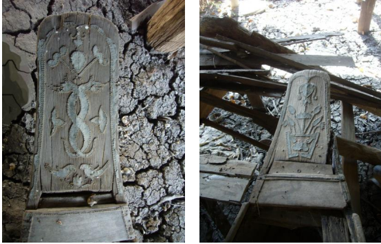
ภาพประกอบ ๔๗ เรือชูด ของลาวแง้วบ้านหนองเมือง