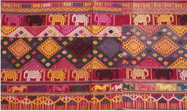
ภาพประกอบ ๓๒ ลายช้างลายม้าที่ปรากฏบน ปลอกหมอนชนิด

๒.๓ ผ้าห่อคัมภีร์ ในสมัยก่อนความรู้ต่างๆจะถูกบันทึกไว้ในใบลาน เรียกว่า “จาร” มีความเชื่อว่า การสร้างหนังสือ คัมภีร์ใบลาน ที่เกี่ยวกับ พระพุทธศาสนาจะได้อันยิ่งใหญ่อันยิ่งด้วยเหตุนี้ เมื่อมีการสร้างคัมภีร์ใบลาน จำเป็นจะต้องมีการเก็บรักษาไว้ให้ดี จึงมีธรรมเนียมนิยมสร้างผ้าห่อคัมภีร์ ใบลานถวายวัด โดยหญิงสาวลาวแฉ่งจะเป็นผู้ที่นำผ้าทอของตนเองมาห่อคัมภีร์ไว้ เนื่องจากความเชื่อว่า ผู้หญิงไม่มีโอกาสพบเหมือนผู้ชาย ดังนั้นผู้หญิงจึงต้อง ทดแทนด้วยการทอผ้าห่อคัมภีร์ขึ้นมา โดยผู้ทอจะทำให้มีขนาดกว้างยาวพอดี กับ ใบลาน และจะทออย่างประณีตงดงาม มีลวดลายสีเส้นตามความคิดสร้างสรรค์ และจินตนาการของผู้ทอ มีทั้งผ้าไหมและผ้าไหม ไม่จำกัด ลวดลาย และนำไป ถวายเพื่อใช้ในการห่อคัมภีร์ และจะเป็นการได้อานิสงฆ์เท่าเทียมกับฝ่ายชาย