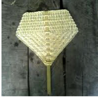
ภาพประกอบ ๗ พัดสาน ของลาวแฉั่วหนองเมือง