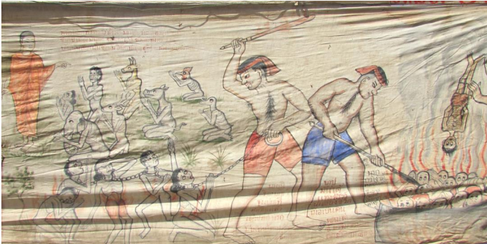
ภาพประกอบ ๕๓ ภาพจิตรกรรมบนผนังผ้า ของลาวแก้วบ้านหนองเมือง