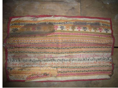
ภาพประกอบ ๓๓ ผ้าห่อคัมภีร์ของลาวแก้วบ้านหนองเมือง

๒.๔ ผ้าม่าน เครื่องกันบัง โดยปรกติทำด้วยผ้า ใช้ห้อยกันห้องหรือประตูหน้าต่าง