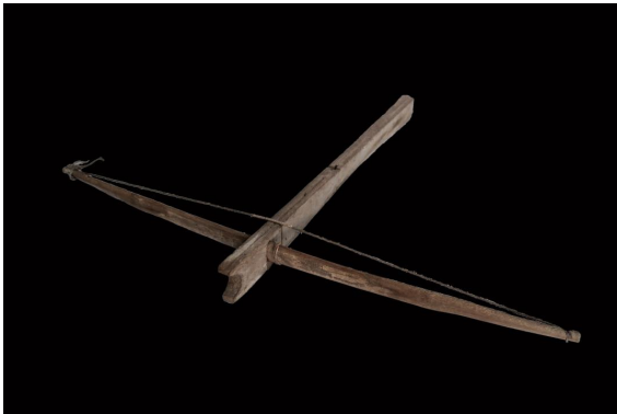
ภาพประกอบ ๔๘ หน้าไม้ ของลาวแง้วบ้านหนองเมือง