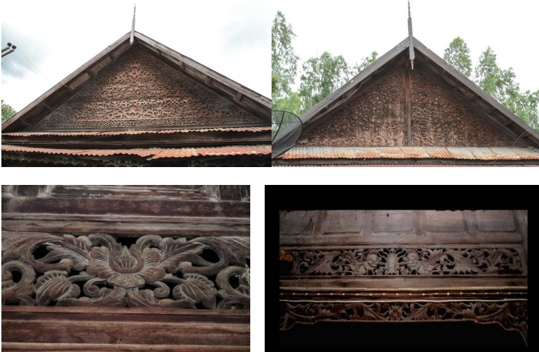
ภาพประกอบ ๔๔ ตัวอย่าง งานฉลุไม้และไม้แกะสลัก ของลาวแวงบ้านหนองเมือง

จากการสัมภาษณ์พบว่าไม้ฉลุ และไม้แกะสลักที่ตกแต่งบ้านของลาวแวงนั้น สร้างขึ้นเพื่อประโยชน์ใช้สอยและความงามเป็นหลัก นอกจากนั้น ลวดลายที่ใช้แกะต้องมีความหมายและเป็นสิริมงคลกับบ้าน เช่นลายดอกไม้ ลายนก