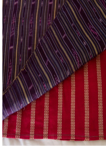
ภาพประกอบ ๒๘ ผ้าซิ่น ต่อดิ้นลายนาค สมบัติของผู้ใหญ่ชญาตา คิมพันธ์