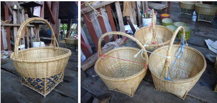
ภาพประกอบ ๔ ตะกร้าและลวดลายของชาวลาวแก้วบ้านหนองเมี่ยง

๑.๒ ตะกร้า เป็นภาชนะสานโปร่งสำหรับใส่สิ่งของ อาจทำด้วยไม้ไผ่หรือวัสดุอื่นเช่นหวาย ใบลาน ใบมะพร้าว มีรูปต่างๆ บางชนิดมีหูหิ้วบางชนิดไม่มี