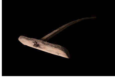
ภาพประกอบ ๔๓ กะโห้ ของลาวแ้วบ้านหนองเมือง