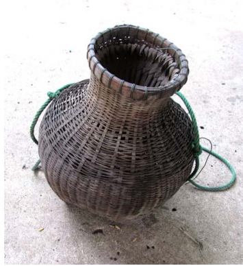
ภาพประกอบ ๘ ค้อง ของลาวแจ้วหนองเมือง

๑.๔ ข้อง เป็นเครื่องจักสานชนิดหนึ่ง สานด้วยผิวไม้ไผ่ ปากแคบอย่างคอหม้อ มีฝาปิดเปิดได้ เรียกว่า ฝาข้อง ฝาข้องมีชนิดที่ทำด้วยกะลามะพร้าว และใช้ไม้ไผ่สานเป็นรูปกรวย ปลายกรวยแหลมปล่อยเป็นซี่ไม้ไผ่เรียกว่า งาแขง ค้องใช้สำหรับใส่ ปลาปู กุ้ง หอย กบ เขียด