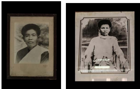
ภาพประกอบ ๑ ภาพถ่ายเก่าของชาวลาวแฉวบ้านหนองเมือง