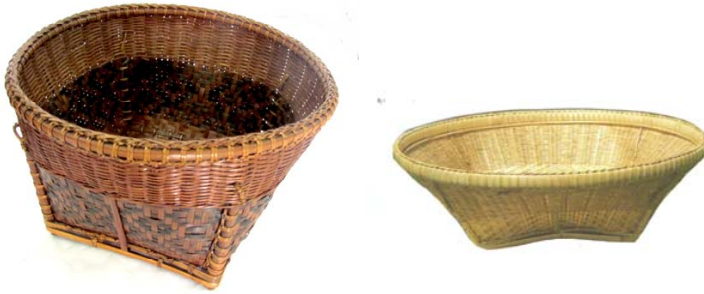
ภาพประกอบ ๓ กระบุงลายขีดและกระบุงครึ่งท่อน ของชาวลาวแก้วบ้านหนองเมือง