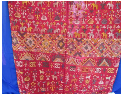
ภาพประกอบ ๓๔ ผ้าม่านของลาวแก้วบ้านหนองเมือง