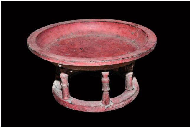
ภาพประกอบ ๔๒ โตก ของลาวแวงบ้านหนองเมือง

จากการสัมภาษณ์พบว่าโตกที่ใช้ในชีวิตประจำวันของลาวแวงนั้น เชื่อ ว่าของที่จะใช้ถวายพระนั้นจะต้องยกขึ้นเหนือพื้นห้ามวางกับพื้น จึงต้องใช้ ภาชนะที่มีขาเช่นโตก