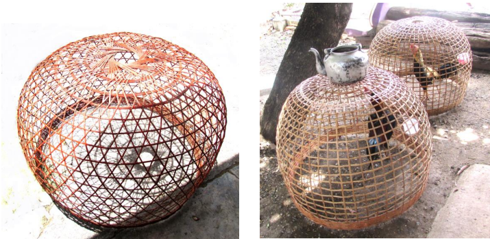
ภาพประกอบ ๕ สุ่มไก่ ของ ลาวแวงหนองเมือง

๑.๕ สุ่มไก่ เป็นอุปกรณ์ที่ใช้สำหรับครอบไก่ขังไก่ จำกัดบริเวณของไก่ นิยมใช้ในการเลี้ยงไก่พื้นบ้านหรือไก่ชน