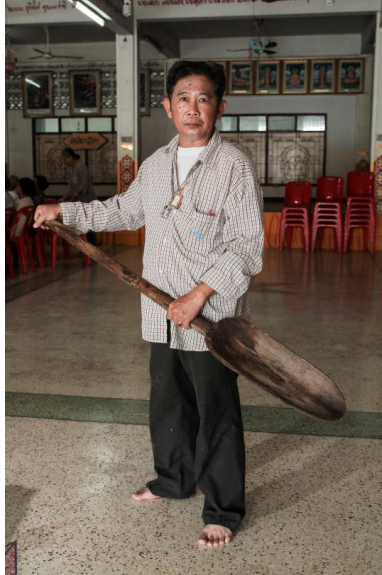
ภาพประกอบ ๔๔ พลับ ของลาวแ้วบ้านหนองเมือง