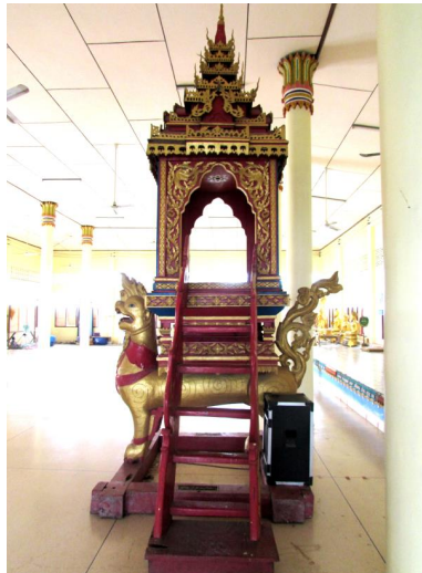
ภาพประกอบ ๕๑ ธรรมาสันสิงห์เทินบุษบก ของลาวแก้วบ้านหนองเมือง