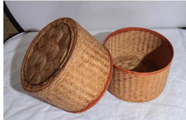
ภาพประกอบ ๒๒ แอบข้าว ของลาวแวงหนองเมือง