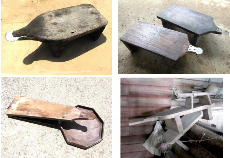
ภาพประกอบ ๔๐ กระจต่าย ของลาวแก้วบ้านหนองเมือง