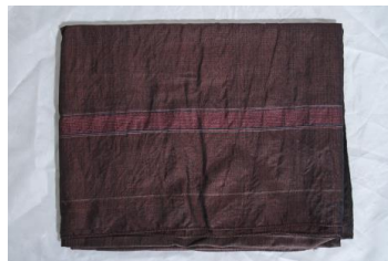
ภาพประกอบ ๒๙ ผ้าซิ่นลายดอกพิกุลต่อหัว และลายน้ำไหลสมบัติของ นางณัฐชา มีเครือ