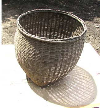
ภาพประกอบ ๕ ตะกร้าและลวดลายของชาวลาวแจ้วบ้านหนองเมือง