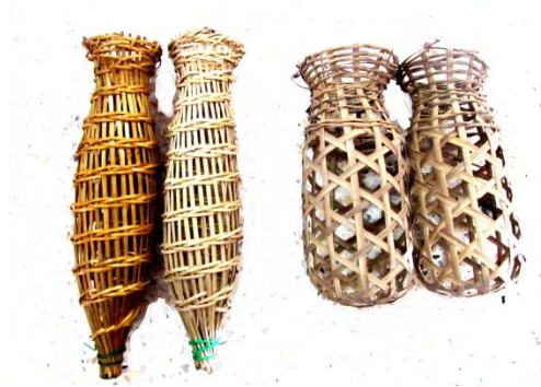
ภาพประกอบ ๑๒ ลอบ ไชขนาดเล็กที่ใช้แขวนหน้าบ้านเพื่อตากสิ่งที่เป็นมงคล ของลาวแฉ้วหนองเมือง

๑.๘ กวัก ทำจากไม้ไผ่สานคล้ายชะลอมทรงสูงขนาดเล็กส่วนขอบ ปากจะสานให้บานออกเล็กน้อย