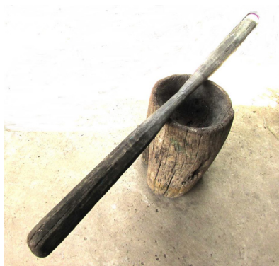
ภาพประกอบ ๔๕ ครกตำข้าว สาก ของลาวแก้วบ้านหนองเมือง