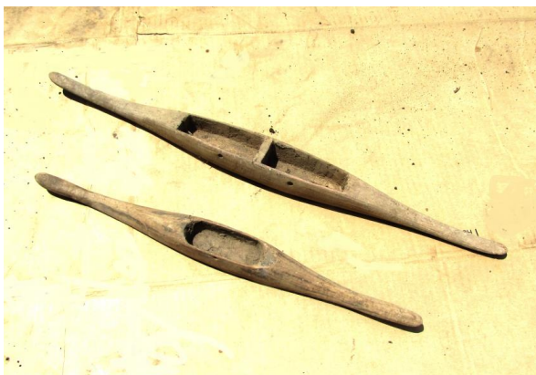
ภาพประกอบ ๓๙ กระสวย ของลาวแง้วบ้านหนองเมือง