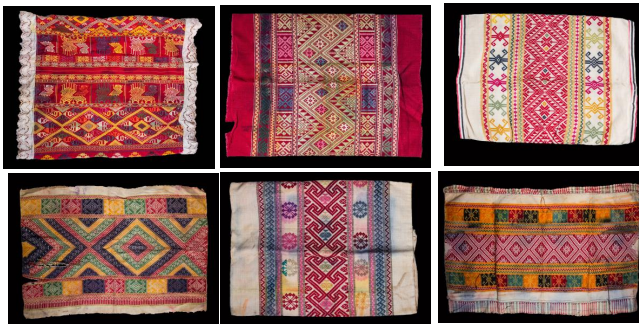
ภาพประกอบ ๓๑ ปลอกหมอนขิด ที่มีลวดลายสวยงามของลาวแก้ว

การทำผ้าขิดนั้นเกี่ยวข้องกับความเชื่อทางศาสนาคือลวดลายที่ขิดเป็นรูปต่างๆ ที่แฝงด้วยความหมาย ที่เป็นมงคล เช่น ลายพญานาค เป็นตัวแทนของความอุดมสมบูรณ์ ลายพญานาคนี้ทอขึ้นถวายพระในเทศกาลงานบุญต่าง ๆ ลายช้าง ช้างเป็นสัตว์คู่บ้านคู่เมืองที่เป็นสัญลักษณ์ของความเป็นใหญ่ค้ำจุนศาสนา ลายม้า ม้าเป็นสัตว์คู่บ้านคู่เมืองเช่นเดียวกันที่เป็นสัญลักษณ์ของความเข้มแข็ง ทรงพลัง และเป็นพาหนะที่พระพุทธเจ้าใช้ขึ้นไปทรงผนวช (สง่า ชันเล็ก.สัมภาษณ์. ๒๕๕๘)