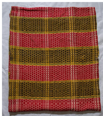
ภาพประกอบ ๓๖ ผ้าปูที่นอน ของนางรัชชดา อนุกุล ลาวแก้วบ้านหนองเมือง