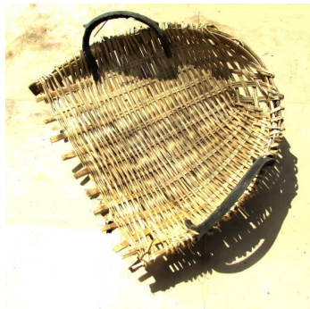
ภาพประกอบ ๑๘ บั้งก็ ของลุง สุวรรณ ประจบการ

๑.๑๓ บั้งก็ เครื่องสานรูปคล้ายเปลือกหอยแครง สำหรับใช้ไถยดิน ไถทราย