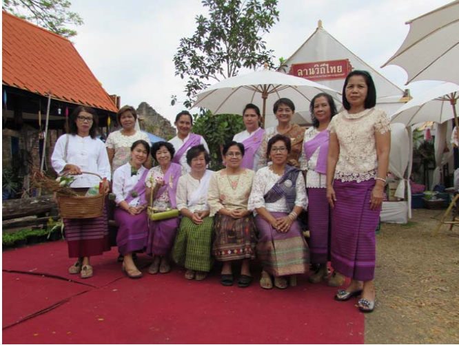
ภาพประกอบ ๒ การแต่งกายลาวแก้วในปัจจุบัน

งานศิลปหัตถกรรมพื้นบ้านที่สำรวจในครั้งนี้ เป็นงานที่เคยใช้ในชีวิตประจำวัน ใช้ในการประกอบอาชีพและใช้ในพิธีกรรมทางศาสนา เมื่อเก็บข้อมูลของงานศิลปหัตถกรรมที่ได้สำรวจในพื้นที่ตำบลหนองเมืองเรียบร้อยแล้ว ได้แยกประเภทของงานศิลปหัตถกรรมของแต่ละประเภท พบว่าในตำบลหนองเมืองมีงานศิลปหัตถกรรมที่สืบทอดกันมา ได้แก่ งานจักสาน งานทอผ้า งานไม้ เครื่องใช้ในชีวิตประจำวัน งานแกะสลัก งานดั่งกล่าวข้างต้นมีรายละเอียดดังนี้