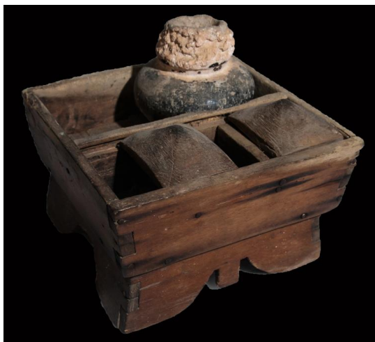
ภาพประกอบ ๓๘ เขียนหมาก สมบัติของนายสุนทร โสภา ลาวแง้ว บ้านหนองเมือง