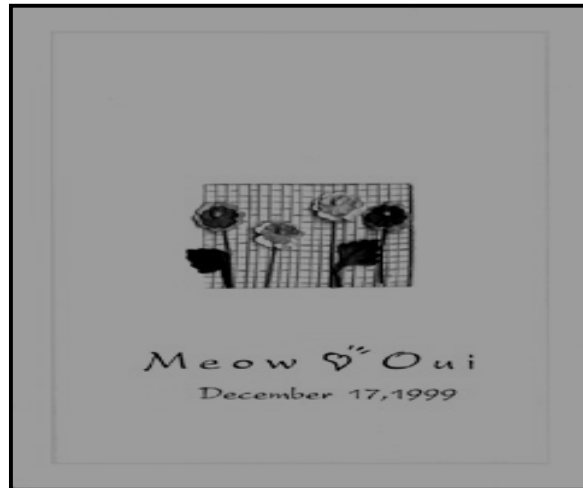
ภาพที่ 1.10 บัตรเชิญวันแต่งงาน สิ่งพิมพ์ที่ใช้ในด้านสังคม

สิ่งพิมพ์ที่กล่าวมาข้างต้นล้วนเป็นสิ่งพิมพ์ที่ผลิตและนำเข้ามาใช้ในการดำเนินกิจกรรมต่าง ๆ ภายในสังคมของมนุษย์ให้เป็นที่ยอมรับและแพร่หลายไปอย่างรวดเร็วจากสังคมหนึ่งไปสู่อีกสังคมหนึ่งเพื่อเป็นกระแสวัฒนธรรมมวลชนต่อไป ดังภาพที่ 1.10