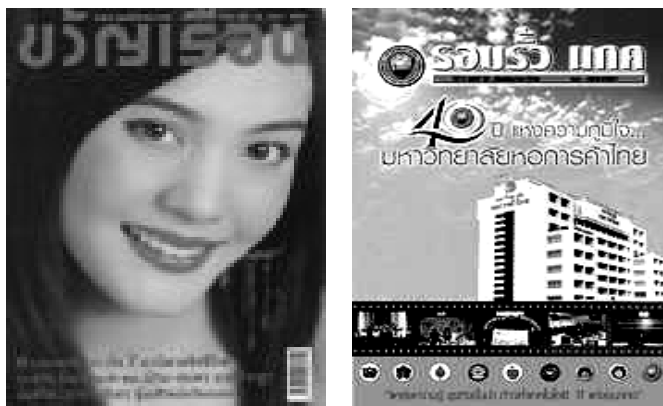
ภาพที่ 1.4 ตัวอย่างนิตยสารและวารสาร

รูปเล่มของวารสารหรือนิตยสาร มีขนาดไม่กำหนดตายตัว แต่ส่วนมากจะมีขนาดประมาณ A4 หรือ ขนาดแปดหน้ายกธรรมดา อาจมีบางฉบับทำให้ใหญ่หรือเล็กกว่านี้บ้าง ดังภาพที่ 1.4