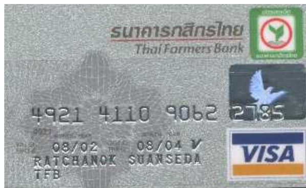
ภาพที่ 1.9 ตัวอย่างบัตรเครดิต

ในบัตรเครดิตสมัยใหม่จะมีการพิมพ์ชื่อผู้ถือบัตรและได้ของผู้ถือบัตรเป็นตัวเลขของพลาสติกอยู่บนบัตรด้วย เพื่อความสะดวกในการทำสำเนาของชื่อผู้ถือบัตรลงบนแบบฟอร์มของบริษัท และการติดตามเก็บเงินในภายหลัง ดังภาพที่ 1.9