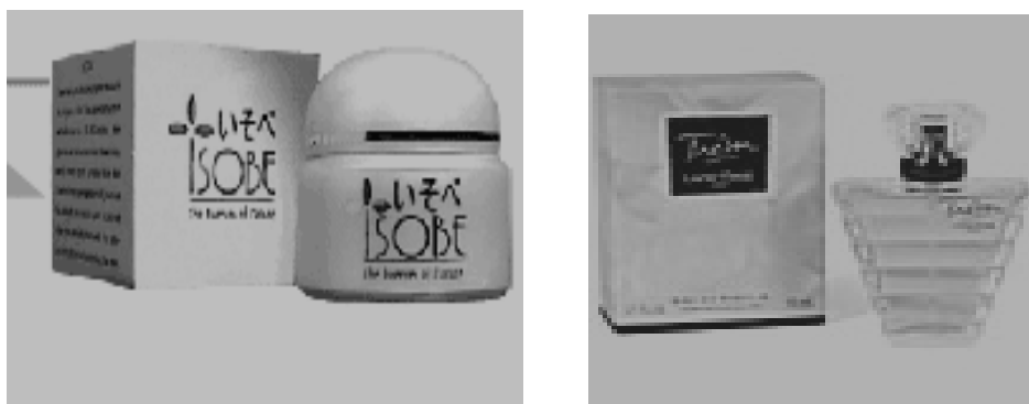
ภาพที่ 1.6 ตัวอย่างสิ่งพิมพ์เพื่อการบรรจุภัณฑ์ ที่มา (honeyglass, 2003)

หลังจากที่สิ่งของ และผลิตภัณฑ์ต่าง ๆ ได้ทำการบรรจุภัณฑ์หลักแล้ว นำหลาย ๆ หน่วยหรือชิ้น มารวมเข้าด้วยกัน มาทำการหีบห่อ ผนึก บรรจุ ในบรรจุภัณฑ์รองอีกครั้งหนึ่ง เพื่อสะดวกต่อการเก็บ การป้องกันความเสียหาย สะดวกต่อการขนส่ง และการจัดจำหน่าย ดังจะยกตัวอย่างการบรรจุภัณฑ์รองที่เห็นได้ทั่วไป คือ กล่องพลาสติกที่บรรจุขวดน้ำอัดลม หีบหรือกล่องกระดาษแข็งสีน้ำตาลบรรจุขวดเบียร์ หรือเหล้า กล่องบรรจุขวดยา กล่องบรรจุหลอดยาสีฟัน และอื่น ๆ ดังภาพที่ 1.6