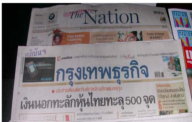
ภาพที่ 1.3 ตัวอย่างหนังสือพิมพ์

หนังสือพิมพ์ประเภทคุณภาพ เป็นหนังสือพิมพ์ที่ผู้บริหารหรือผู้มีการศึกษาพอสมควรนิยมอ่าน มีจำนวนจำหน่ายไม่สูงนัก มุ่งเน้นเสนอข่าวหนัก (hard news) เช่น ข่าวเศรษฐกิจ การเมือง สังคม การศึกษา เป็นข่าวที่มุ่งสนองความรู้ ความคิดเห็นเป็นสำคัญ ทำให้ผู้อ่านเกิดความรู้ความเข้าใจและสามารถนำไปใช้เป็นประโยชน์เพื่อวัตถุประสงค์ต่าง ๆ ได้ เช่น เป็นข้อมูลในการตัดสินใจ วิพากษ์วิจารณ์ เป็นต้น ตัวอย่างหนังสือพิมพ์ประเภทคุณภาพ ได้แก่ หนังสือพิมพ์มติชน สยามรัฐ กรุงเทพธุรกิจ เดอะเนชั่น เป็นต้น ดังภาพที่ 1.3