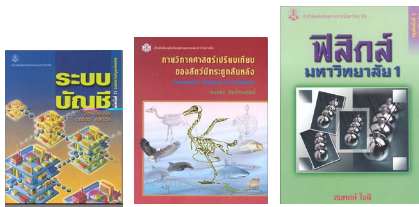
ภาพที่ 1.1 ตัวอย่างหนังสือแบบเรียน

เรียบง่ายของการจัดวางชื่อเรื่อง และองค์ประกอบอื่น ๆ บนหน้าปก ใช้สีค่อนข้างเคร่งขรึม ส่วนหน้าปกหนังสือแบบเรียนของเด็กเล็ก จะทำให้สะดุดตาด้วยภาพและสีที่ฉูดฉาดชวนใจ และชนิดของปก อาจเป็นปกอ่อน หรือปกแข็ง ให้เหมาะกับลักษณะและสภาพของหนังสือ ดังภาพที่ 1.1