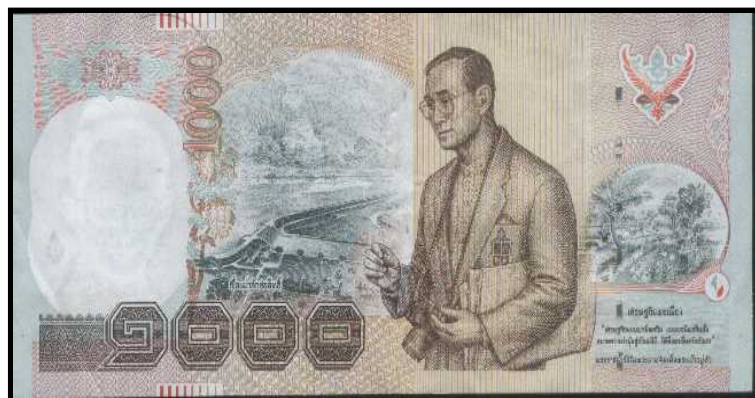
ภาพที่ 1.7 ธนบัตร สิ่งพิมพ์ที่มีค่าชนิดหนึ่งที่ มีมา (ศิลปะ/ของสะสม, 2546)

กระดาษที่ใช้พิมพ์ธนบัตรจะต้องเป็นกระดาษที่จัดทำขึ้นเป็นพิเศษ และจะต้องมีส่วนประกอบที่ให้ความมั่นคงปลอดภัยไว้ในเอกสารนั้น ๆ ซึ่งได้แก่ ลายน้ำ (watermark) เส้นมั่นคง (security thread) ใยไหม (colored fibers) และแพลนเชต (planchette) กระดาษธนบัตรจะต้องทำขึ้นจากฝ้ายและลินิน (rags) เท่านั้น เพื่อให้ได้คุณลักษณะความแข็งแรงและแข็งแกร่งของกระดาษธนบัตรดังที่ทุกคนใช้อยู่ทั่วไป ควรสังเกตว่าฝ้ายและลินินไม่มีการนำไปใช้ในการทำกระดาษทั่วไปเพราะมีราคาแพง ดังภาพที่ 1.7