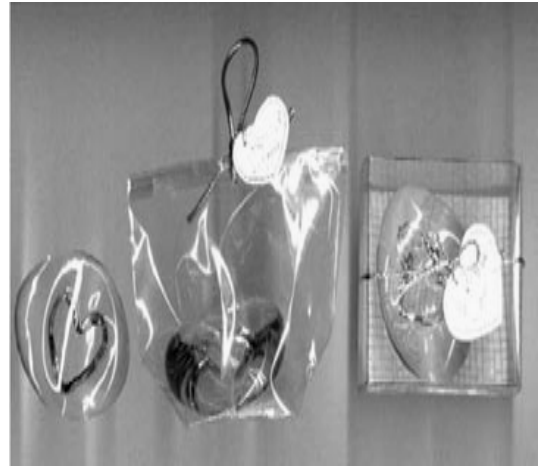
ภาพที่ 1.12 การพิมพ์บนหน้าปัดนาฬิกา และแก้ว สิ่งพิมพ์ที่ใช้ในวัตถุประสงค์พิเศษ