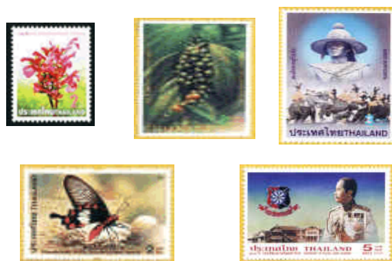
ภาพที่ 1.8 ตัวอย่างแสตมป์ไปรษณีย์

แสตมป์ไปรษณีย์ เป็นสิ่งพิมพ์มีค่าที่แตกต่างไปจากพิมพ์มีค่าอื่น ๆ ตรงที่แสตมป์ไปรษณีย์จะต้องออกแบบให้มีศิลปะงดงามเพื่อถูกใจนักสะสมแสตมป์ การพิมพ์แสตมป์ไปรษณีย์ในปัจจุบันนี้ ใช้ระบบการพิมพ์แบบเดียวกับที่ใช้ในทางการค้าทั้งหลาย เช่น ออฟเซต หรือโฟโตกราฟี เป็นต้น ดังภาพที่ 1.8