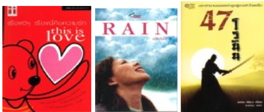
ภาพที่ 1.2 ตัวอย่างหนังสือที่เป็นบันเทิงคดี

ข้อแตกต่างของหนังสือบันเทิงคดี และที่เป็นสารคดี ได้แก่ หนังสือบันเทิงคดี เป็นการรับรู้ทางอารมณ์และปัญญา ส่วนหนังสือที่เป็นสารคดีเป็นการรับรู้ทางปัญญาเพียงอย่างเดียว แต่ไม่ว่าจะเป็นหนังสือประเภทใดก็ตาม นับได้ว่าเป็นสื่อสำคัญในการถ่ายทอดความรู้ต่าง ๆ ที่ทำให้มนุษย์สามารถดำเนินชีวิตไปด้วยดีและมีคุณภาพสูงขึ้น ดังภาพที่ 1.2