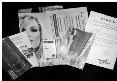
ภาพที่ 1.5 ตัวอย่างสิ่งพิมพ์โฆษณา

จะเห็นได้ว่าสิ่งพิมพ์โฆษณาจัดทำขึ้นเพื่อวัตถุประสงค์ที่แตกต่างกันก็จะทำให้เกิด สิ่งพิมพ์โฆษณาที่ใช้สำหรับงานนั้น ๆ แตกต่างกันไปด้วยทั้งเนื้อหาและรูปแบบของสิ่งพิมพ์ โฆษณาที่มีให้เห็นอยู่มากมายหลายชนิดที่ถูกนำมาใช้ในองค์การต่าง ๆ ดังภาพที่ 1.5